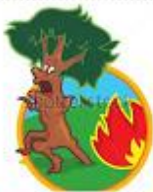
Κινδυνεύουν τα δέντρα