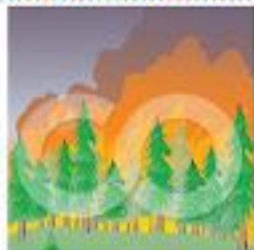
Καίγονται τα δάση