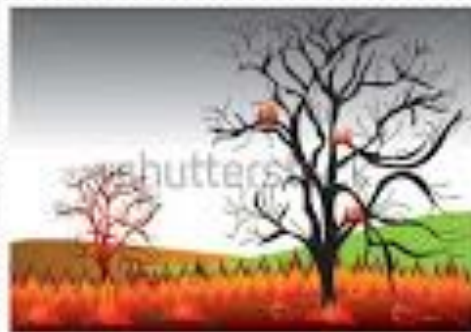
Τα δέντρα καίγονται