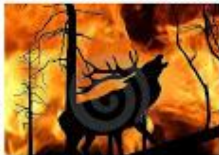
Τα ζώα κινδυνεύουν , εξοπταλείουν τα δάση ή χάνουν τη ζωή τους