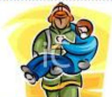
Κινδυνεύουν ανθρώπινες ζωές