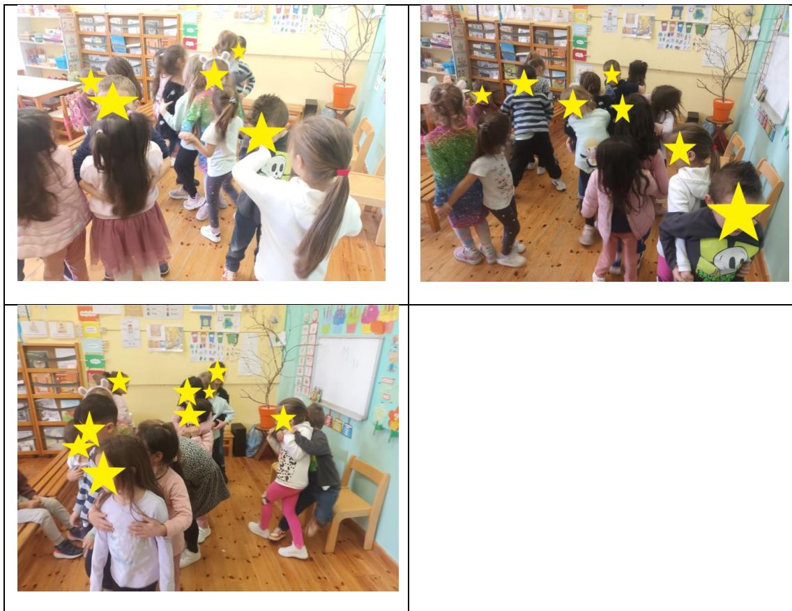
«Παιχνίδια γνωριμίας και συνεργασίας»