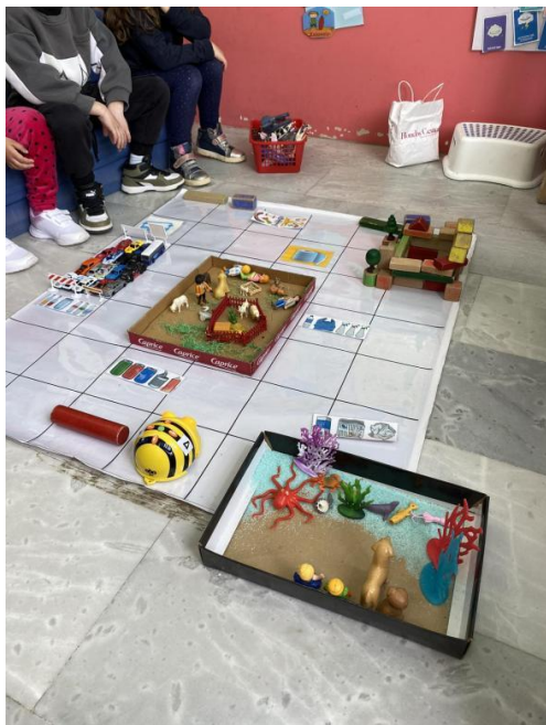
«Δημιουργία πόλης από παιχνίδια της τάξης»