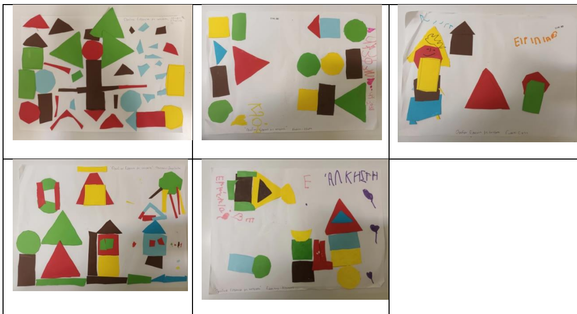
«Ομαδικές εργασίες με σχήματα»

Τα παιδιά χωρίζονται σε μικρές ομάδες των 2-3 ατόμων. Η κάθε ομάδα θα πάρει από ένα χαρτί σε μέγεθος Α3 και χαρτόνια που έχουν σχεδιασμένα γεωμετρικά σχήματα (τετράγωνο, κύκλος, τρίγωνο, ορθογώνιο). Στη συνέχεια, θα κληθούν να συνεργαστούν να κόψουν και να δημιουργήσουν ένα κολάζ. Το κολάζ μπορεί να γίνει και ομαδικό από όλη την τάξη.