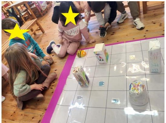
«Δημιουργία πόλης από ανακυκλώσιμα υλικά»