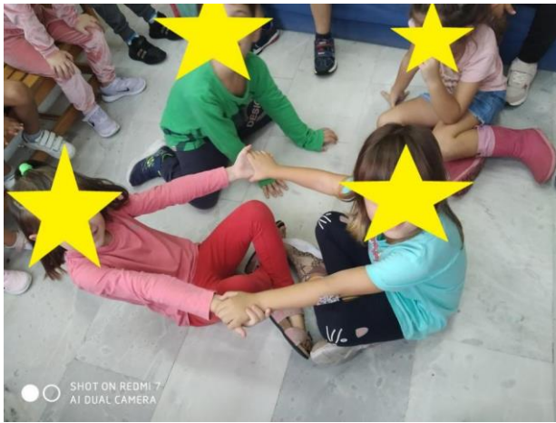
«Παιχνίδια γνωριμίας και συνεργασίας»

Παίζουμε παιχνίδια γνωριμίας και συνεργασίας.