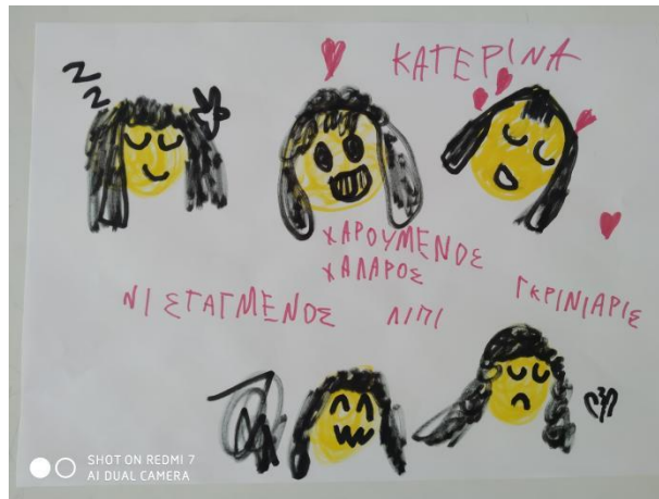
«Ατομικές εργασίες για τα συναισθήματα»