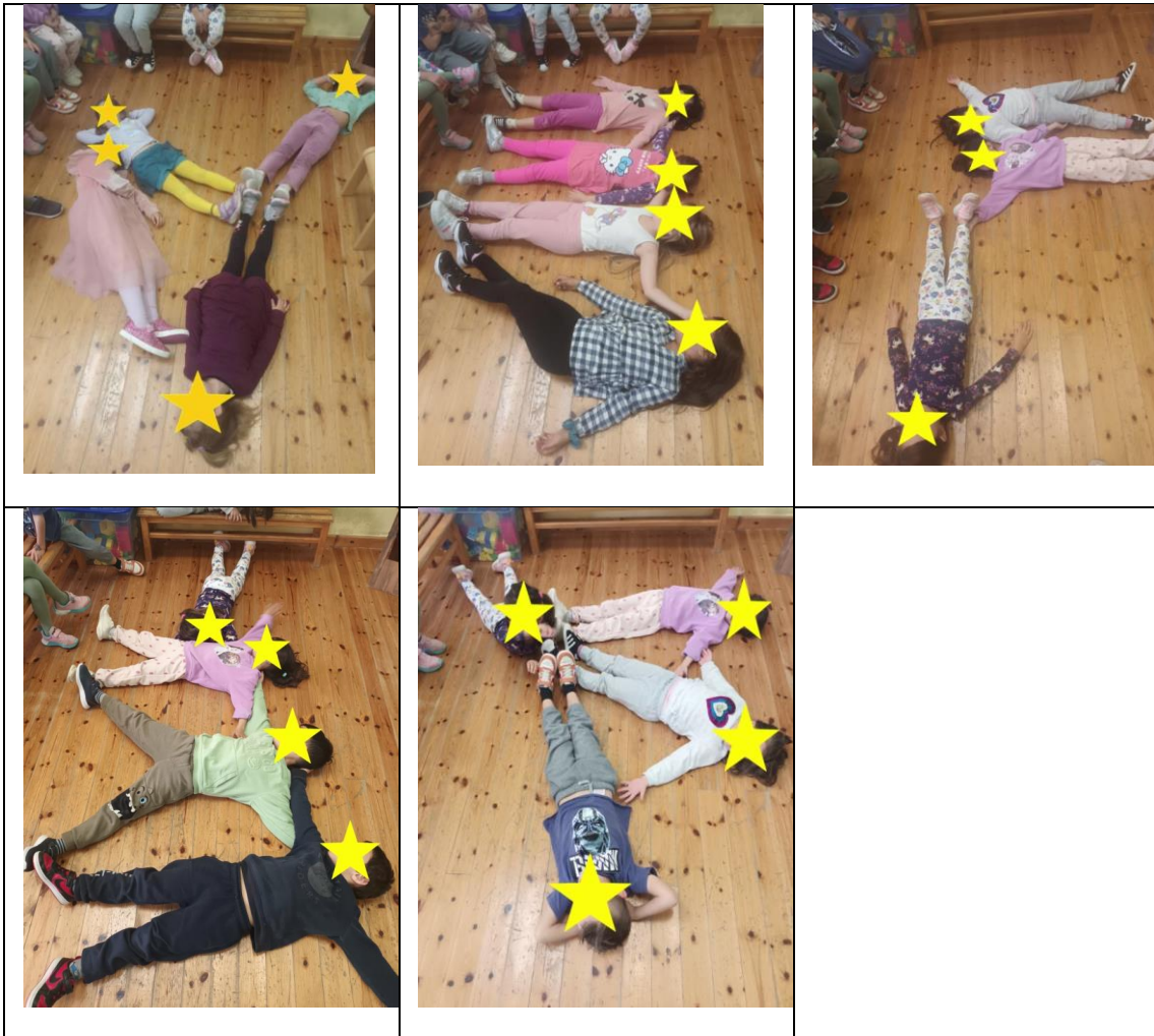
Παιχνίδι «Ανθρώπινο Παζλ»

Τα παιδιά σε ομάδες των τεσσάρων πέντε ατόμων γίνονται τα κομμάτια ενός παζλ. Ένα παιδί ξαπλώνει στο πάτωμα με τα χέρια και τα πόδια σε όποια θέση θέλει. Τα υπόλοιπα συνεχίζουν το παζλ μπαίνοντας όπου υπάρχει χώρος, ακουμπώντας όμως σε κάποιο σημείο το παιδί. Όταν όλα βρουν τη θέση τους, τους ζητάτε να θυμηθούν που ακριβώς είναι η θέση τους στο παζλ.. Στη συνέχεια με το άκουσμα της μουσικής κινούνται ελεύθερα στο χώρο. Στο σταμάτημα, τους ζητάμε να ξαναφτιάξουν το παζλ μπαίνοντας ο καθένας στη θέση που είχε πριν. Στο τέλος η κάθε ομάδα παρουσιάζει το δικό της παζλ στις υπόλοιπες που σχολιάζουν τι μπορεί να παριστάνει.