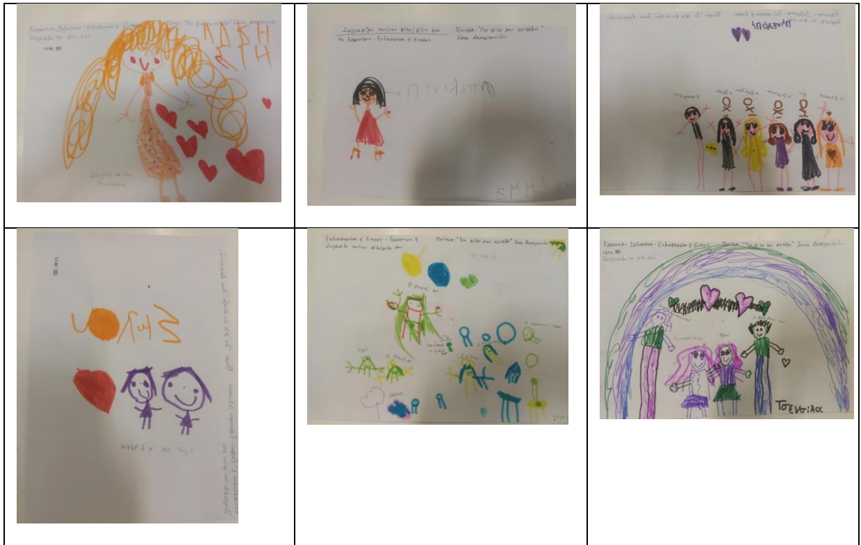
«Ζωγραφίζω τον φίλο μου»

Διαβάζουμε την ιστορία Έλμερ ο παρδαλός ελέφαντας στην ομάδα και συζητάμε ότι το διαφορετικό δεν είναι κάτι που πρέπει να μας τρομάζει και να το απορρίπτουμε, όπως επίσης ότι δεν πρέπει να φοβόμαστε να κρατήσουμε τη δική μας διαφορετικότητα, τη μοναδικότητά μας. Όταν οι μοναδικότητες ενώνονται, κερδίζει το σύνολο, κερδίζει η ομάδα.