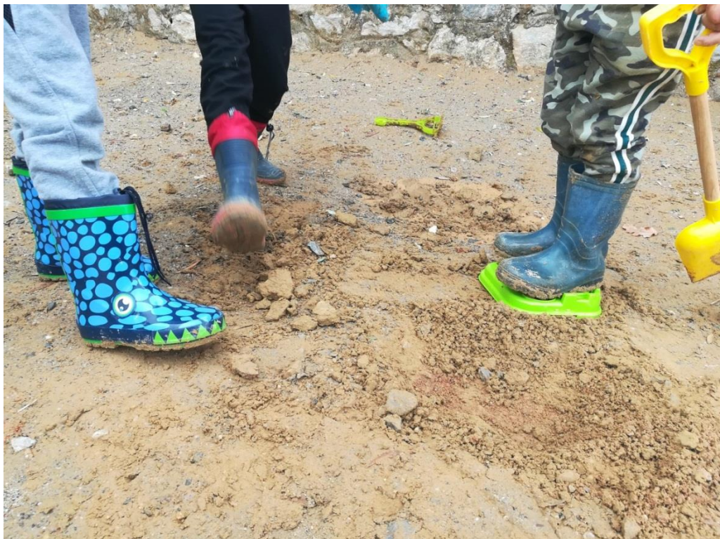
Τα αγαπημένο σετ: λάσπη και γαλότσες!