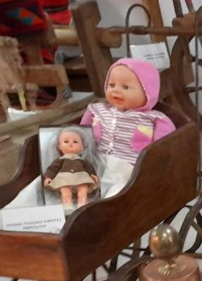
ΣΥΝΘΕΣΗ ΠΛΕΚΤΩΣ ΚΑΠΟΤΕΣ ΠΡΟΒΛΕΤΙΣΤΟΥ