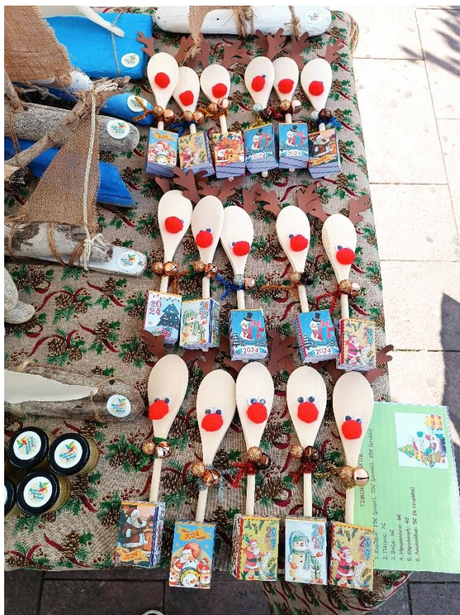
Καλή μας χρονιά λοιπόν με υγεία σε μικρούς και μεγάλους!!!!!!!!!!!!!!!!!!!!!!