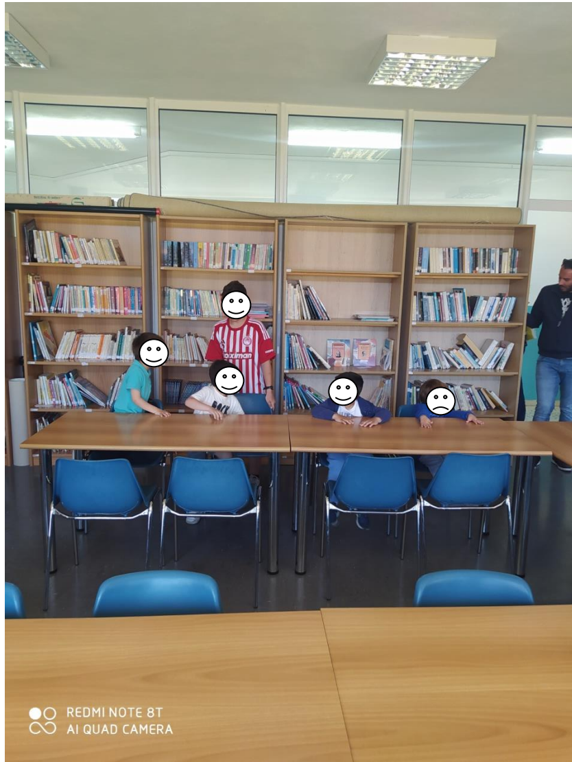
Ένας μαθητής μάς έδειξε μια κατασκευή για την παγκόσμια ημέρα παιδικού βιβλίου...