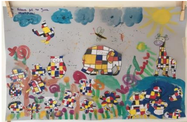
Το αγαπημένο μας ζώο σε στυλ Μοντριάν