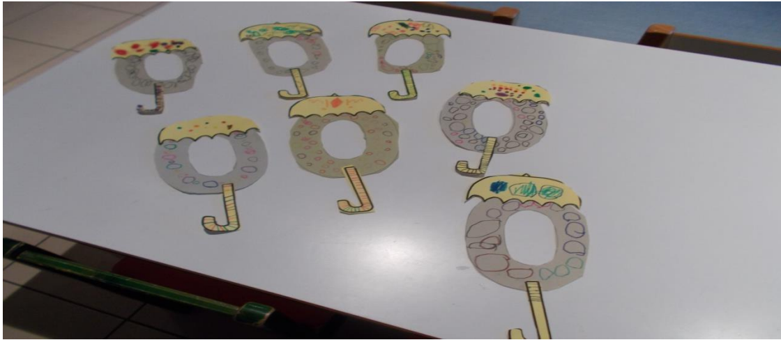
ΚΑΙ ΤΟ Ο ΤΟΥ ΟΚΤΩΒΡΗ ΚΑΙ ΤΟΥ ΟΧΙ.