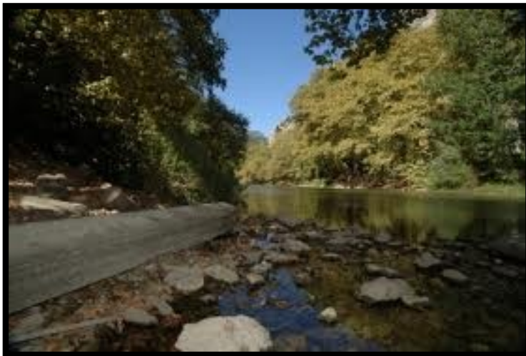
ΕΘΝΙΚΟ ΠΑΡΚΟ ΔΑΔΙΑΣ