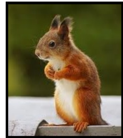
ΧΕΛΩΝΕΣ ΚΑΙ ΜΙΚΡΑ – ΜΕΣΑΙΑ ΘΗΛΑΣΤΙΚΑ