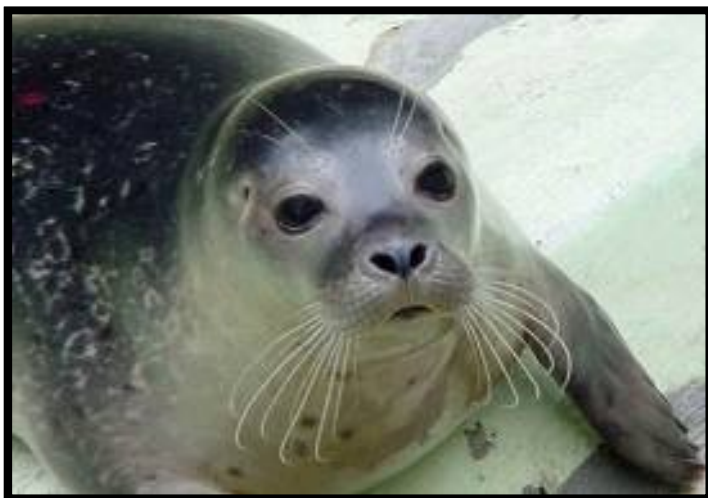
ΜΕΣΟΓΕΙΑΚΗ ΦΩΚΙΑ ΜΟΧΑΧΟΥΣ ΜΟΝΑΧΟΥΣ