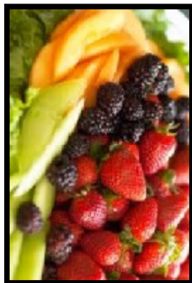
ΦΡΟΥΤΑ ΚΑΙ ΜΟΥΡΑ