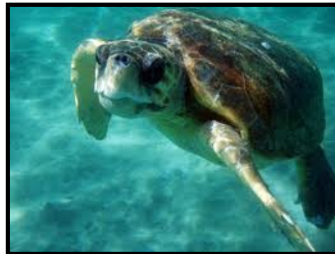
ΘΑΛΑΣΣΙΑ ΧΕΛΩΝΑ ΚΑΡΕΤΑ-ΚΑΡΕΤΑ