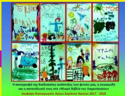
Η καταγραφή της διαδικασίας ανάπτυξης των φυτών μας, η συγχροική και η κατανάλωσή τους στο «Μικρό Βιβλίο του Λαχανόκηπου» Αειφόρο Νηπιαγωγείο Αγίων Σαράντα Χανίων 2017 - 2018