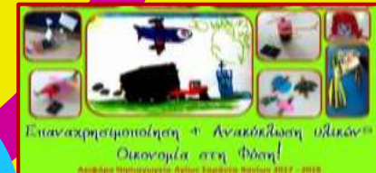
Επαναχρησιμοποίηση + Ανακύκλωση υλικών Οικονομία στη Φύση! Λειψόφορο Νηπιαγωγείο Αγίων Σαράντα Χανίων 2017 - 2018