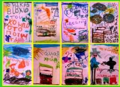
Η καταγραφή της διαδικασίας της παραγωγής του βιολογικού/οικολογικού χύματος/λίπασμάτος μας στο «Μικρό βιβλίο του Κομποστοποιητή» Λειψόφορο Νηπιαγωγείο Αγίων Σαράντα Χανίων 2017 - 2018