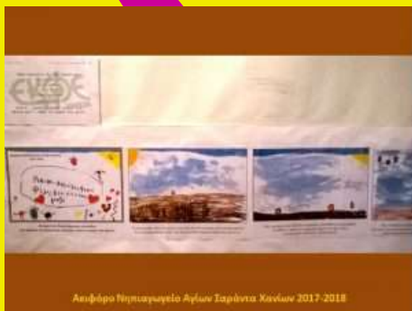
Αειφόρο Νηπιαγωγείο Αγίων Σαράντα Χανίων 2017 - 2018

Γιορτάζοντας τις Φυσικές Επιστήμες στα Χανιά, 2018