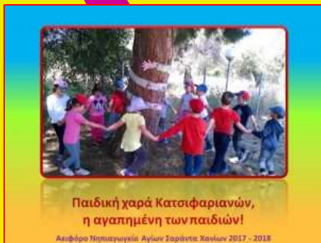
Παιδική χαρά Κατσιφარიανών, η αγαπημένη των παιδιών!