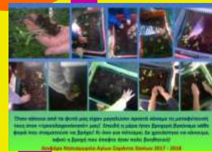
Όταν σπείρα από τα φυτό μας είναι γεμάτα λαχανάκια είναι η μαθησιακή τους από κηπουρική/αποκτητική μας! Στενάβει η μάση γύρω Σχολική Οικονομία αλλά φέρει και αναμνηστική να βάλει! Κι ένα για λόγους: Σε διαφορετικό να ονόμασε, αφού η Σχολή και έφαγε άνοι πολύ (ανάμεσα)!

Η ρεβιθιά και η φασολιά μας έδωσαν καρπούς