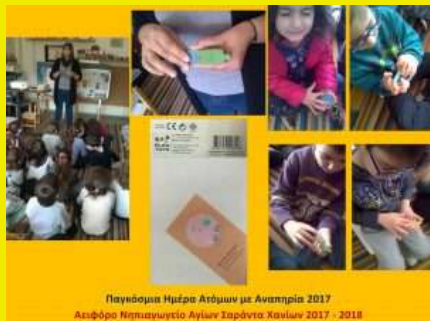
Παγκόσμια Ημέρα Ατόμων με Αναπηρία 2017 Λειψόφο Νηπιαγωγείο Αγίων Σαράντα Χανίων 2017 - 2018

Με παιχνίδια γνωριμίας, αποδοχής και συνεργασίας δημιουργήσαμε τις ομάδες της τάξης μας!