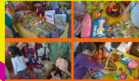
4 η Ημέρα Επαναχρησιμοποίησης, 23 Νοεμβρίου 2017. «Βιβλία - παιχνίδια που αλλάζουν χέρια» Επαναχρησιμοποίηση βιβλίων/παιχνιδιών Λειψόφορο Νηπιαγωγείο Αγίων Σαράντα Χανίων 2017 - 2018

Ο κομποστοποιητής μας σε πλήρη λειτουργία!