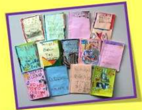
Τα Μικρά Βιβλία της Παιδαγωγικής Freinet στο νηπιαγωγείο μας!

Τα «Μικρά Βιβλία» της Παιδαγωγικής Freinet στο νηπιαγωγείο μας!