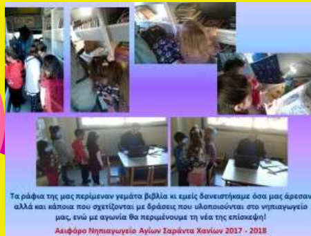
Τα ράφια της μας περιμένουν γεμάτα βιβλία κι εμείς δραπετίζουμε όσα μας άρεσαν αλλά και κάποια που σχετίζονται με δράσεις που υλοποιούνται στο νηπιαγωγείο μας ενώ με αγωνία θα περιμένουμε τη νέα της επίσκεψη! Αειφόρο Νηπιαγωγείο Αγίων Σαράντα Χανίων 2017 - 2018

Η Κινητή Βιβλιοθήκη του Δήμου Χανίων στο νηπιαγωγείο μας