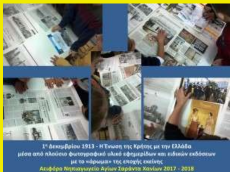
1 ο Δεκεμβρίου 1913 - Η Ένωση της Κρήτης με την Ελλάδα μέσα από πλούσιες φωτογραφίες, υλικό εφημερίδων και ειδικών εκδόσεων με το κάρναμα της εποχής εκείνης Αειφόρο Νηπιαγωγείο Αγίων Σαράντα Χανίων 2017 - 2018

104 χρόνια από την Ένωση της Κρήτης με την Ελλάδα