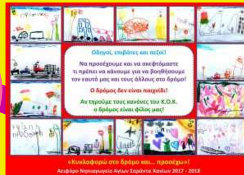
«Κυκλοφορώ στο δρόμο και... προσέχω!» Αειφόρο Νηπιαγωγείο Αγίων Σαράντα Χανίων 2017 - 2018