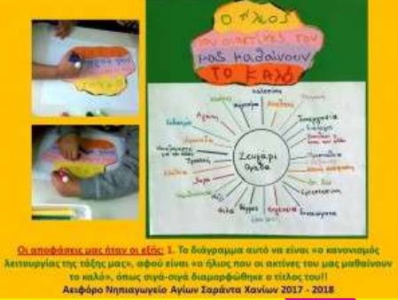
Οι αποφάσεις μας όταν οι ετήσι. Το διάγραμμα αυτό να είναι «ο κανονισμός λειτουργίας της τάξης μας», αφού είναι «ο ήλιος που οι ακτίνες του μας μεταφέρουν το καλό», όπως σιγά-σιγά διαμορφώθηκε ο τίτλος του!! Λειφόρο Νηπιαγωγείο Αγίων Σαράντα Χανίων 2017 - 2018