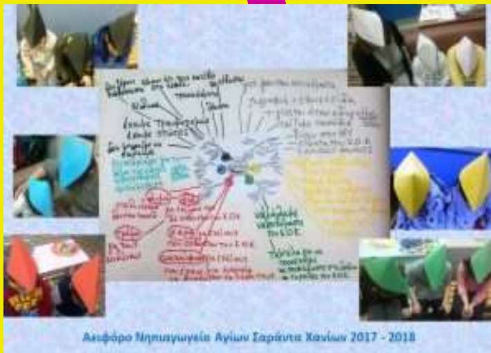
Αειφόρο Νηπιαγωγείο Αγίων Σαράντα Χανίων 2017 - 2018

Τα Έξι Καπέλα της Σκέψης του Edward de Bono Κυκλοφορώ στο δρόμο και... προσέχω!