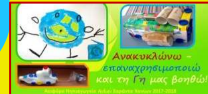
Ανακυκλώνω - επαναχρησιμοποιώ και τη Γη μας βοηθώ! Λειψόφορο Νηπιαγωγείο Αγίων Σαράντα Χανίων 2017 - 2018

Επαναχρησιμοποίη ση και ανακύκλωση υλικών όλοι μαζί για να σώσουμε τη Γη!