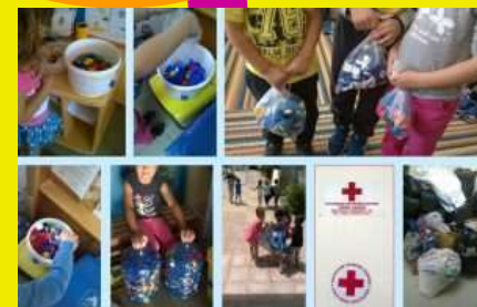
Εκστρατεία συλλογής πλαστικών καπακιών Λειψόφο Νηπιαγωγείο Αγίων Σαράντα Χανίων 2017 - 2018