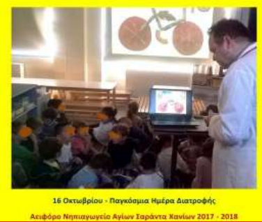
16 Οκτωβρίου - Παγκόσμια Ημέρα Διατροφής Δειφόρο Νηπιαγωγείο Αγίων Σαράντα Χανίων 2017 - 2018