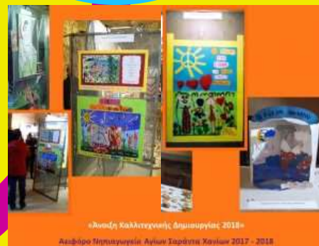
«Άνοιξη Καλλιτεχνικής Δημιουργίας 2018» Αειφόρο Νηπιαγωγείο Αγίων Σαράντα Χανίων 2017 - 2018

Συμμετοχή στην «Άνοιξη Καλλιτεχνικής Δημιουργίας 2018»