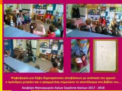
Ψηφοφορία για λήψη Συμπεραστικών αποφάσεων με ανάθεση του κεραιο ο κρέερος μετράει και ο γραμματέας σημειώνει το αποτέλεσμα στο βιβλίο του... Λειφόρο Νηπιαγωγείο Αγίων Σαράντα Χανίων 2017 - 2018