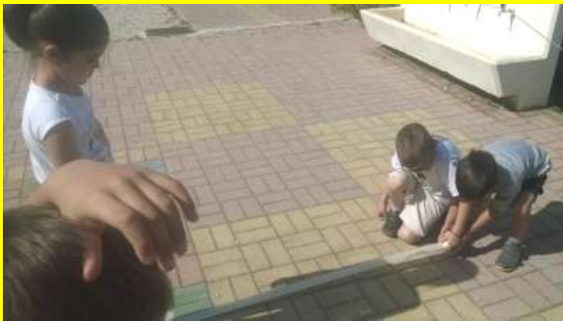
πρωί - μεγάλη σκιά