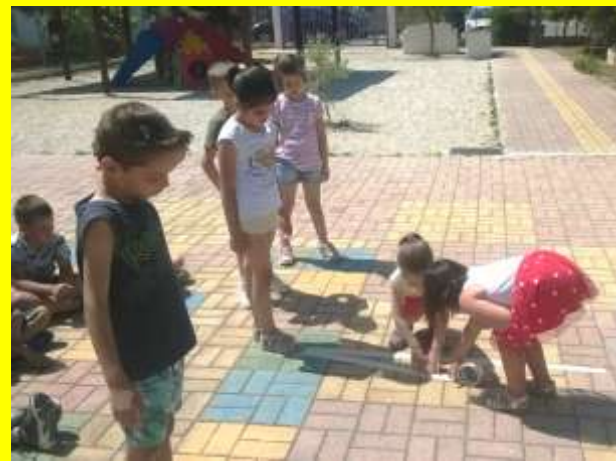
μεσημέρι - μικρή σκιά