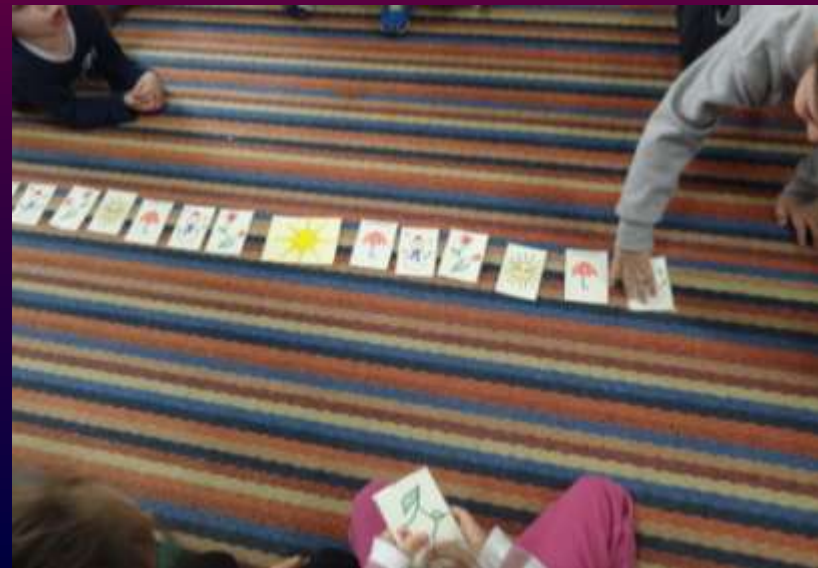
Παίξαμε με κάρτες τη διαδοχή/εναλλαγή των 4 εποχών Ολόημερο Νηπιαγωγείο Αγίων Σαράντα Χανίων 2015 - 2016