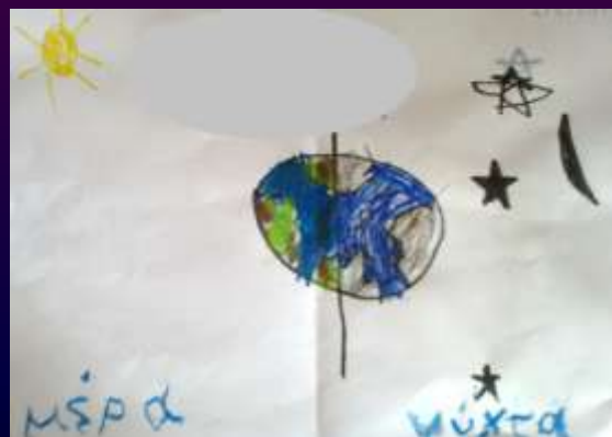
Ζωγραφίσαμε τη μέρα και τη νύχτα στον πλανήτη μας Ολόημερο Νηπιαγωγείο Αγίων Σαράντα Χανίων 2015 - 2016