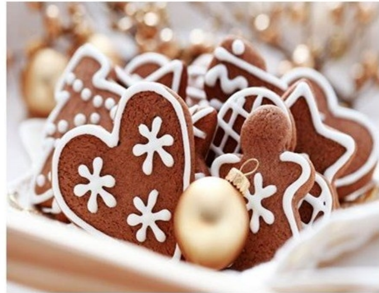
ΦΤΙΑΧΝΟΥΜΕ ΧΡΙΣΤΟΥΓΕΝΝΙΑΤΙΚΑ ΚΟΥΛΟΥΡΙΑ