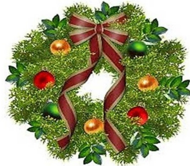
ΚΡΕΜΑΜΕ ΤΟ ΧΡΙΣΤΟΥΓΕΝΝΙΑΤΙΚΟ ΣΤΕΦΑΝΙ