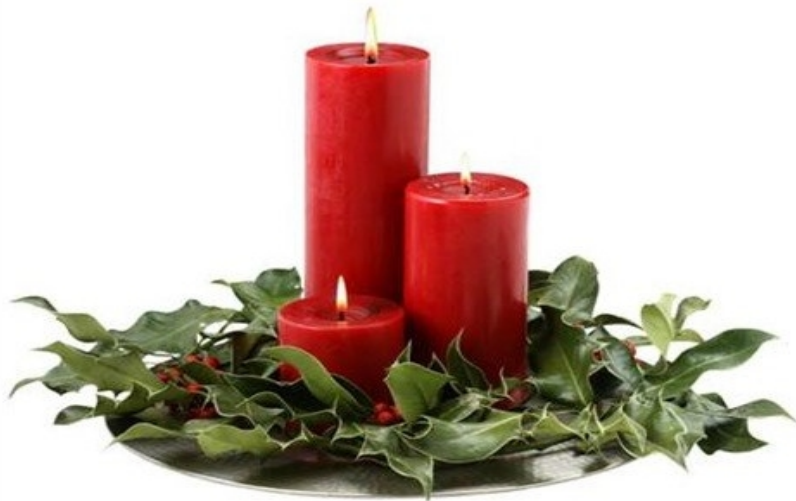
ΑΝΑΒΟΥΜΕ ΧΡΙΣΤΟΥΓΕΝΝΙΑΤΙΚΑ ΚΕΡΙΑ