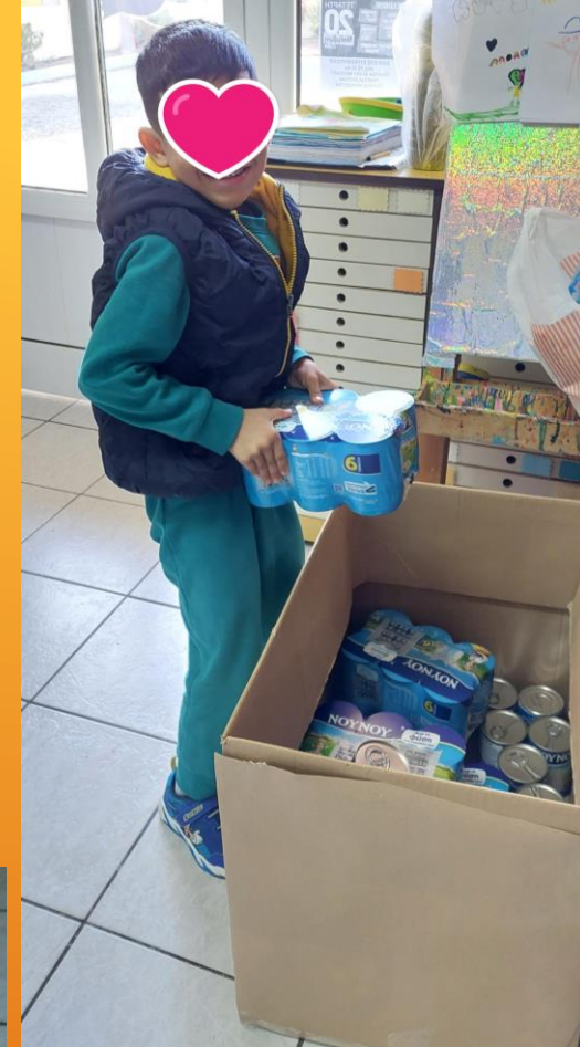
«Το κουτί της προσφοράς!»