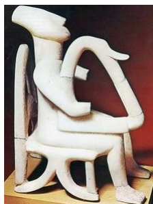
Μαρμάρινο ειδώλιο: άντρας που παίζει άρπα