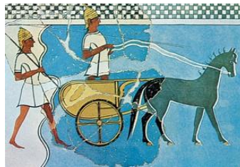
πολεμιστές με άρμα