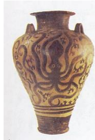
αγγείο με χταπόδι