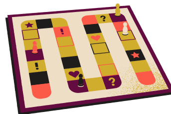
Επιτραπέζιο παιχνίδι 14.99€