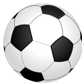
Επώνυμη μπάλα ποδοσφαίρου 17,99€