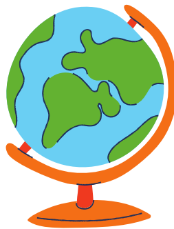
Μεγάλη υδρόγειο σφαίρα 9,99€