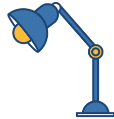
Φωτιστικό γραφείου 4.99€