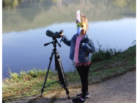
Φωτογραφίες από τις δράσεις Χελιδονίσματα και γιορτή πουλιών.