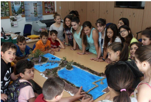
Κατασκευή μακέτας της λιμνοθάλασσας Κουτάβου.