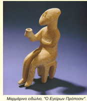
Μαρμάρινο ειδώλιο, "Ο Εγγύριον Πρόσοψις"