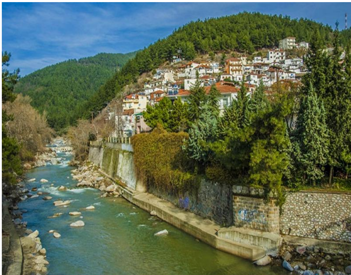
Υλικό 2: Εικόνα για περιγραφή