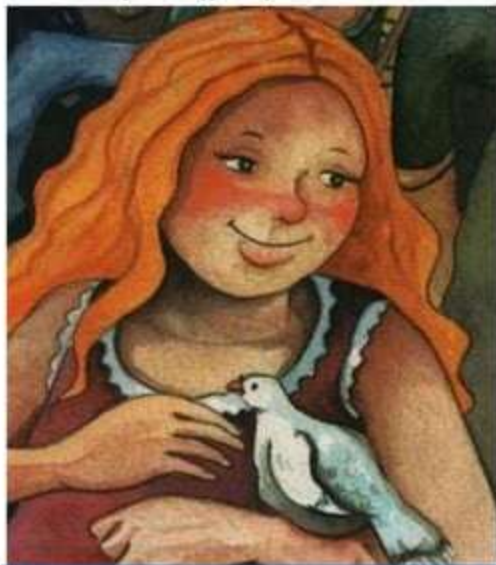
Η κυρά δημοκρατία