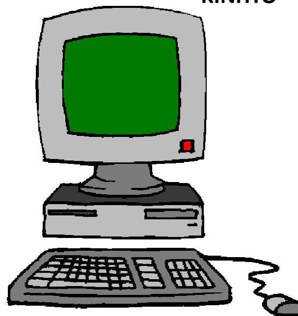
ΥΠΟΛΟΓΙΣΤΗΣ - INTERNET