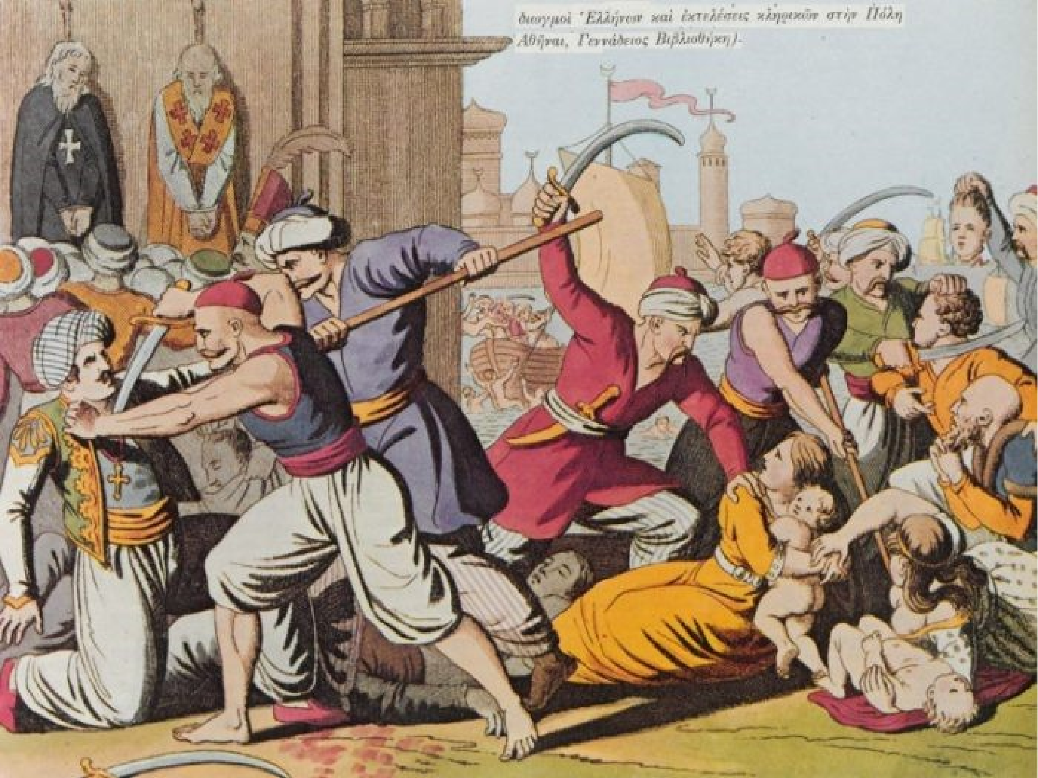
διοργμοί Ἑλλήνων καὶ ἐκτελέσεις κληροκίων στὴν Πόλη Ἀθήναι, Γεννάδειος Βιβλιοθήκη).