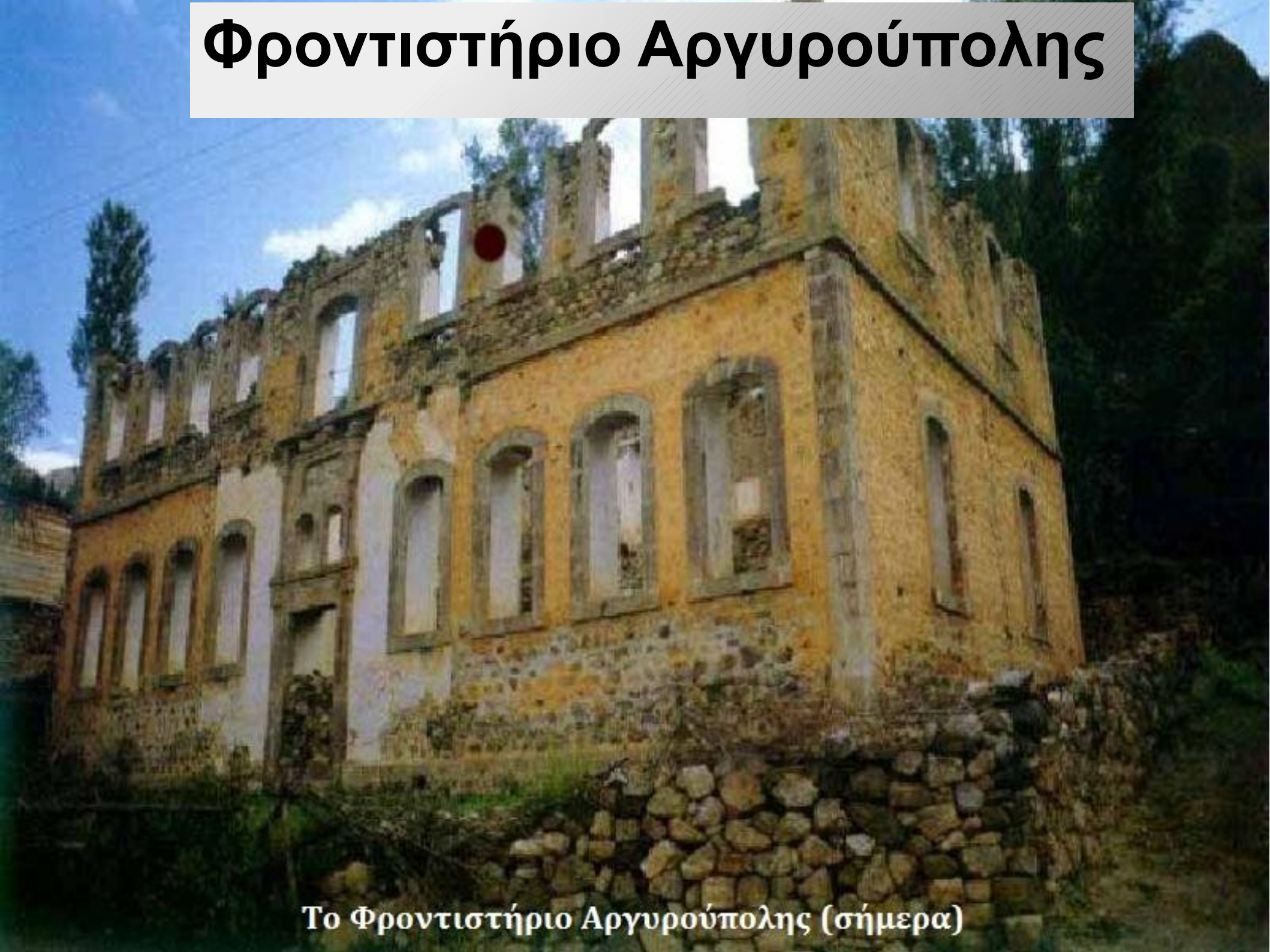
Το Φροντιστήριο Αργυρούπολης (σήμερα)