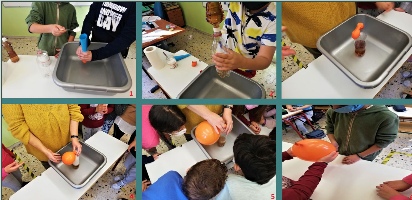
Πείραμα: Παραγωγή διοξειδίου του άνθρακα CO 2