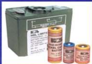
Μπαταρίες Νικελίου/ Καδμίου