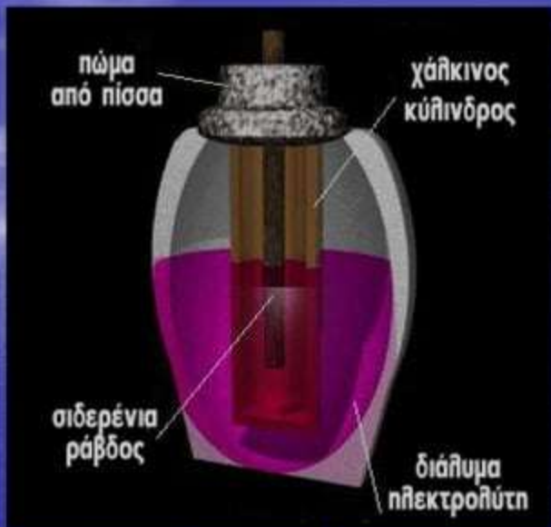
Η μπαταρία της Βαυδάτης

Το 1938 ο Γερμανός αρχαιολόγος Wilhem Konig ανακάλυψε μία κατασκευή παρόμοια με την μπαταρία στην Βαυδάτη. Η κατασκευή είχε το μέγεθος μίας γροθιάς και ήταν φτιαγμένη από πηλό. Δεν έχει αποδειχθεί όμως ότι ήταν όντως μία πρωτόγονη μπαταρία.