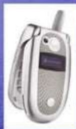
Διάφορες φορητές συσκευές