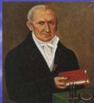
Alessandro Cont di Volta (1745-1827)

Ας πούμε μερικά πράγματα για την ιστορία της μπαταρίας. Οι επιστήμονες Luigi Galvani και Alessandro Cont di Volta ήταν οι πρώτοι που παρατήρησαν τα ηλεκτρικά φαινόμενα και τις επιπτώσεις τους στους οργανισμούς. Ο Volta κατασκεύασε την πρώτη μπαταρία, από πλάκες ψευδαργύρου και χαλκού.