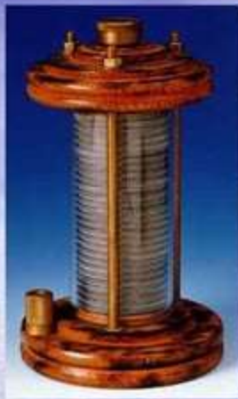
Η μπαταρία του Volta (βολταϊκή στήλη)