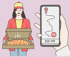
un service de livraison de pizzas