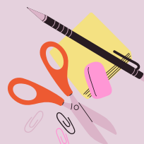
du matériel scolaire