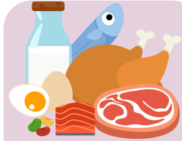
de la nourriture