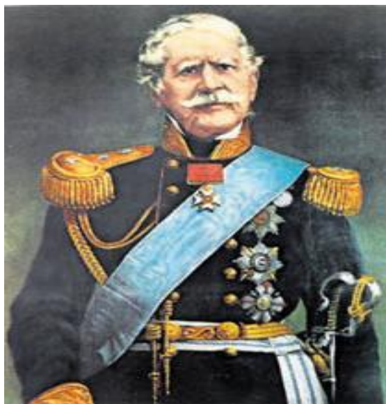
Ο Άγγλος επικεφαλής των χερσαίων δυνάμεων Richard Church, Εθνικό Ιστορικό Μουσείο, Αθήνα

Στις 3 Μαρτίου με 3000 άνδρες ο Καραϊσκάκης κινήθηκε προς το Κερατσίνι και κατέστρωσε σχέδια για τη συντριβή του Κιουταχί. Η πρώτη του επιτυχία την επομένη, τον ενθάρρυνε και άρχισε τις προετοιμασίες για την οργάνωση του αποκλεισμού του Τούρκου στρατηγού. Στο μεταξύ ο Άγγλος φιλέλληνας Τσωρτς, στον οποίο η Τρίτη Εθνική Συνέλευση (1827) είχε αναθέσει την αρχηγία του στρατού, είχε την άποψη ότι μόνο με γενική επίθεση εναντίον των Τούρκων θα ήταν δυνατό να λυθεί η πολιορκία της Ακρόπολης. Ο Καραϊσκάκης μάταια προσπάθησε να τον μεταπείσει τονίζοντας τους μεγάλους κινδύνους που θα διέτρεχαν οι Έλληνες από το εχθρικό πυροβολικό και το ιππικό, και η επιχείρηση ορίστηκε για το βράδυ της 22ας προς την 23η Απριλίου. Ο Καραϊσκάκης, μολονότι εκείνη την ημέρα ήταν άρρωστος με πυρετό, βγήκε από τη σκηνή του και περιστοιχισμένος από το ελληνικό ιππικό όρμησε εναντίον των Τούρκων. Τραυματισμένος θανάσιμα κατά τη διάρκεια της μάχης μεταφέρθηκε στη γολέτα του Τσωρτς και λίγες ώρες αργότερα πέθανε.