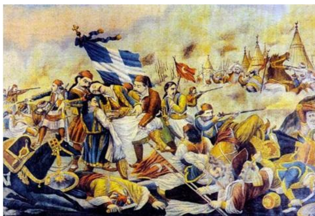
Ο θάνατος του Καραϊσκάκη

Ο θάνατος του Καραϊσκάκη υπήρξε αληθινή συμφορά για την εξέλιξη των επιχειρήσεων εναντίον των Τούρκων στην Αττική και αποθάρρυνε τους Έλληνες που έβλεπαν στο πρόσωπο του έναν άξιο ηγέτη, γεγονός που αναγνωρίζουν όλοι οι ιστορικοί και απομνημονευματογράφοι του Αγώνα. Χαρακτηριστικά είναι όσα γράφει ο Σπυρίδων Τρικούπης στην Ιστορία της Ελληνικής Επανάστασης: «προσηλώθη αναποσπάστως εις την εθνικήν δόξαν, διεκρίθη ως ουδείς άλλος και εν μέσω δεινής απορίας εφείλκυσε πλήθη πεινώντων και γυμνητευόντων και τους ωδήγησεν εις την δόξαν, όχι θεραπεύων, αλλά χαλινών τας ορέξεις των και απαγορεύων τας καταχρήσεις των».