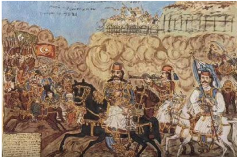
Θεόφιλος, Η καταδίωξη των Τούρκων στην Στερεά Ελλάδα από τον Καραϊσκάκη

Στις 3 Μαρτίου με 3000 άνδρες ο Καραϊσκάκης κινήθηκε προς το Κερατσίνι και κατέστρωσε σχέδια για τη συντριβή του Κιουταχί. Η πρώτη του επιτυχία την επομένη, τον ενθάρρυνε και άρχισε τις προετοιμασίες για την οργάνωση του αποκλεισμού του Τούρκου στρατηγού. Στο μεταξύ ο Άγγλος φιλέλληνας Τσωρτς, στον οποίο η Τρίτη Εθνική Συνέλευση (1827) είχε αναθέσει την αρχηγία του στρατού, είχε την άποψη ότι μόνο με γενική επίθεση εναντίον των Τούρκων θα ήταν δυνατό να λυθεί η πολιορκία της Ακρόπολης. Ο Καραϊσκάκης μάταια προσπάθησε να τον μεταπείσει τονίζοντας τους μεγάλους κινδύνους που θα διέτρεχαν οι Έλληνες από το εχθρικό πυροβολικό και το ιππικό, και η επιχείρηση ορίστηκε για το βράδυ της 22ας προς την 23η Απριλίου. Ο Καραϊσκάκης, μολονότι εκείνη την ημέρα ήταν άρρωστος με πυρετό, βγήκε από τη σκηνή του και περιστοιχισμένος από το ελληνικό ιππικό όρμησε εναντίον των Τούρκων. Τραυματισμένος θανάσιμα κατά τη διάρκεια της μάχης μεταφέρθηκε στη γολέτα του Τσωρτς και λίγες ώρες αργότερα πέθανε.