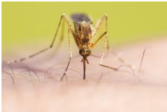
Κ όπως ΚΟΥΝΟΥΠΙ