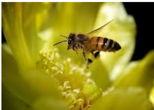
Μ όπως ΜΕΛΙΣΣΑ