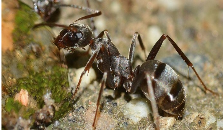
Μ όπως ΜΥΡΜΗΓΚΙ