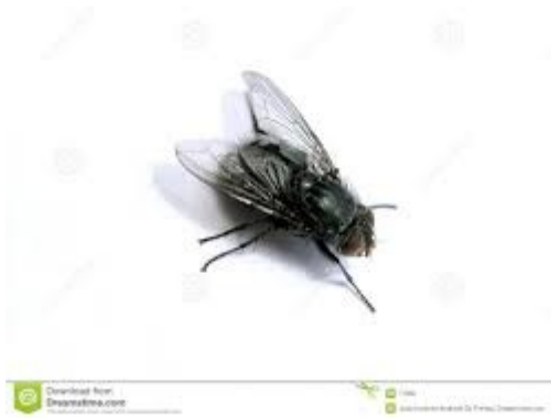
Μ όπως ΜΥΓΑ