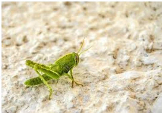
Α όπως ΑΚΡΙΔΑ