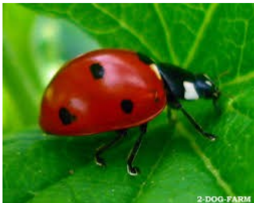
Π όπως ΠΑΣΧΑΛΙΤΣΑ