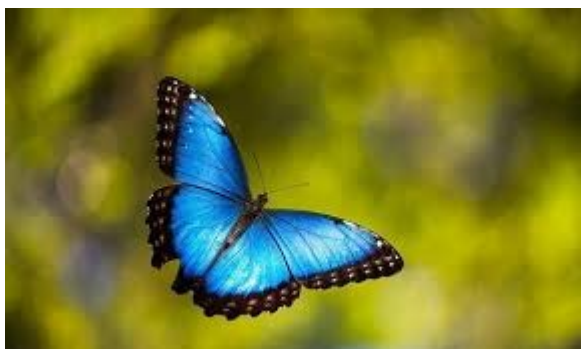
Π όπως ΠΕΤΑΛΟΥΔΑ