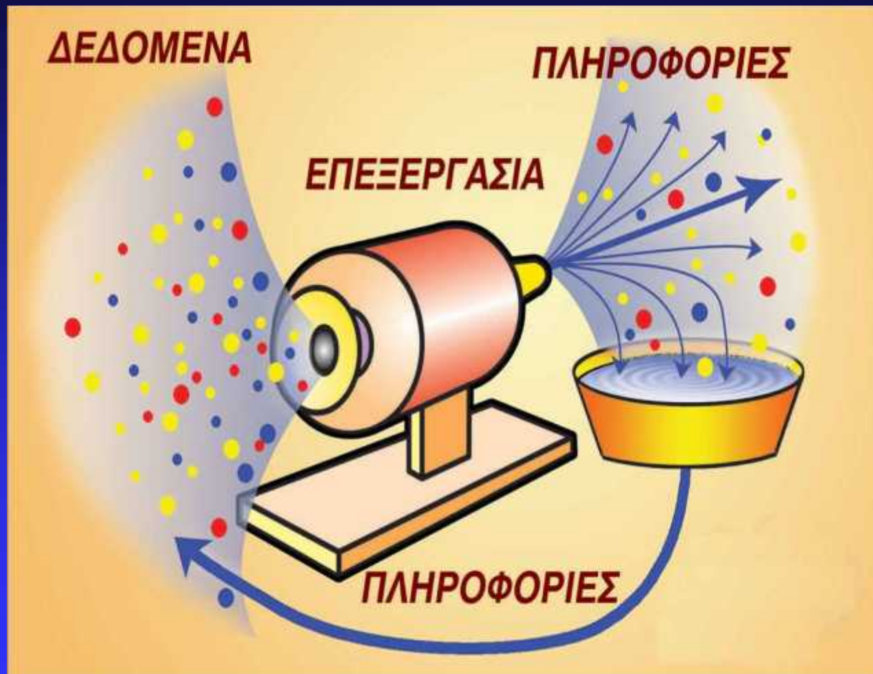
Εικόνα 1.1: Κύκλος Επεξεργασίας των Δεδομένων

μ (Data), (Information), (Processing), (Computer), (Informatics )