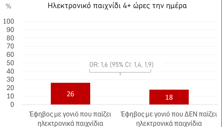
Γράφημα 4. Ποσοστό των εφήβων 11-15 ετών στην Ελλάδα που παίζουν ηλεκτρονικά παιχνίδια για 4+ ώρες ημερησίως, ανάλογα με το εάν έχουν γονιό που α) επίσης παίζει ή β) δεν παίζει ηλεκτρονικά παιχνίδια