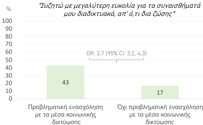
Γράφημα 3. Ποσοστό των εφήβων 11-15 ετών στην Ελλάδα που «συμφωνούν» ότι θα τους ήταν ευκολότερο να συζητήσουν με μεγαλύτερη ευκολία για τα συναισθήματά τους διαδικτυακά, απ' ό,τι δια ζώσης ανάλογα με το εάν εμφανίζουν α) προβληματική ή β) μη-προβληματική ενασχόληση με τα μέσα κοινωνικής δικτύωσης

Ένας στους 5 (20%) εφήβους ηλικίας 11-15 ετών στην Ελλάδα θα συμφωνούσε με την άποψη ότι θα του ήταν ευκολότερο να συζητήσει για τα συναισθήματά του διαδικτυακά από ό,τι δια ζώσης. Η αντίληψη αυτή είναι δημοφιλέστερη στα κορίτσια (έναντι των αγοριών), στους 13-, και 15χρονους (έναντι των 11χρονων) (δεν φαίνεται σε γράφημα) και ιδιαίτερα στους εφήβους με προβληματική ενασχόληση με τα μέσα κοινωνικής δικτύωσης (Γράφημα 3).