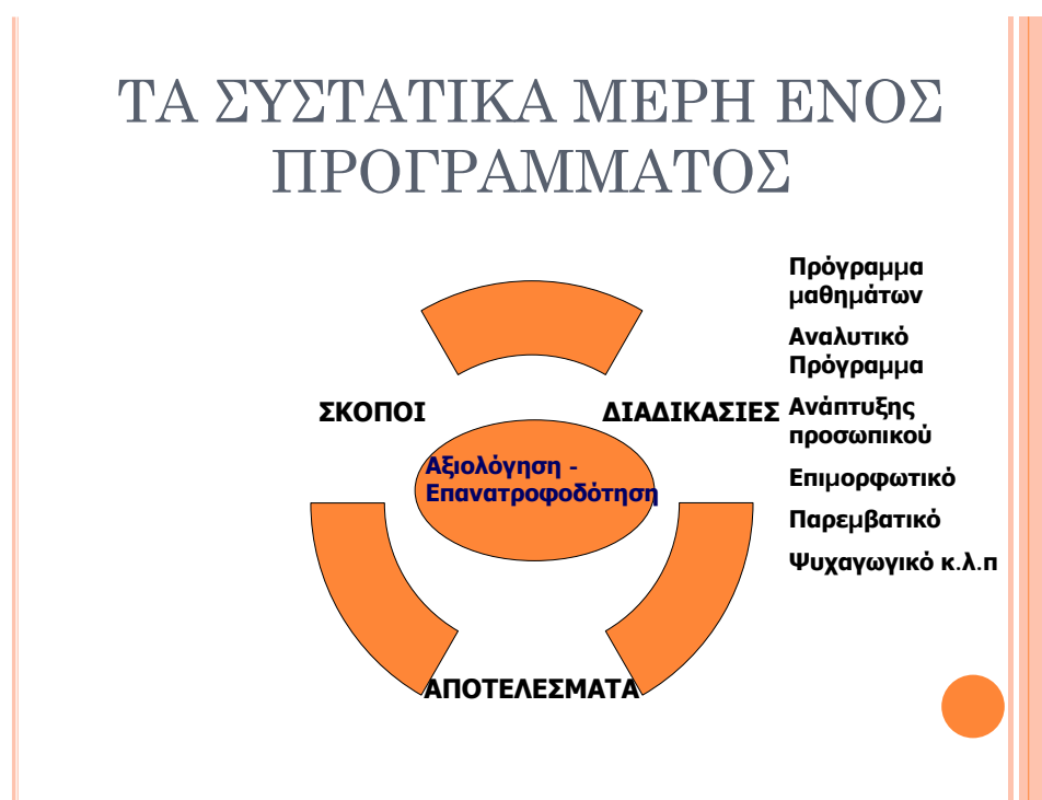
Διάγραμμα 3: Τα συστατικά στοιχεία ενός Αναλυτικού Προγράμματος