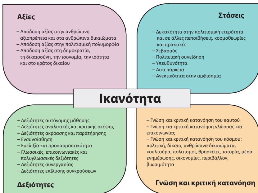
Διάγραμμα 1: Οι 20 ικανότητες που περιλαμβάνονται στο μοντέλο των ικανοτήτων

Το μοντέλο προτείνει ότι, μέσα στα όρια του δημοκρατικού πολιτισμού και του διαπολιτισμικού διαλόγου, ένα άτομο θεωρείται πως ενεργεί ικανά όταν αντιμετωπίζει κατάλληλα και αποτελεσματικά τις απαιτήσεις, τις προκλήσεις και τις ευκαιρίες που προκύπτουν από τις δημοκρατικές και διαπολιτισμικές καταστάσεις, με την κινητοποίηση και την ανάπτυξη μέρους ή του συνόλου αυτών των 20 ικανοτήτων. Καθεμία από τις τέσσερις ομάδες ικανοτήτων, καθώς και όλες οι επιμέρους ικανότητες κάθε ομάδας, περιγράφονται λεπτομερώς στη συνέχεια.