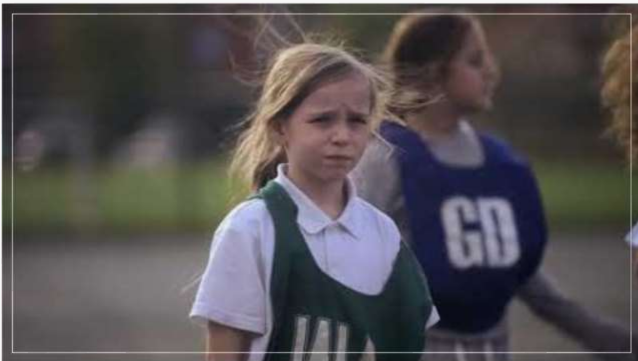
NSPCC, Say Something Tv ad (2017)