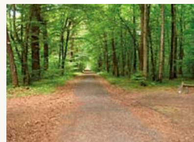
Wald 80x50 cm 14,20 Euro