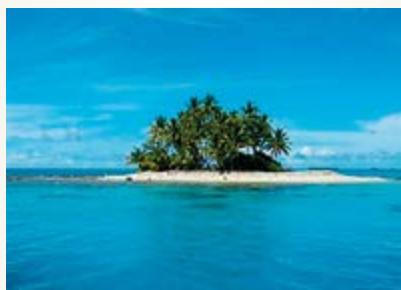
Insel 80x45 cm 13,50 Euro