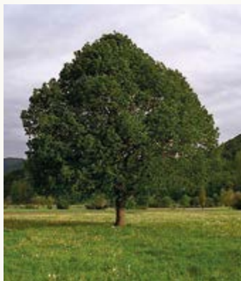
Natur 70x100 cm 7 Euro