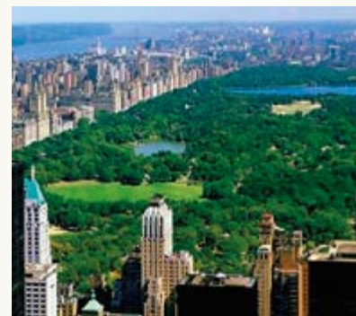
New York (Central Park) 90x60 cm 11,30 Euro