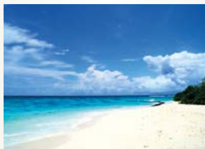
Meer 80x50 cm 15 Euro