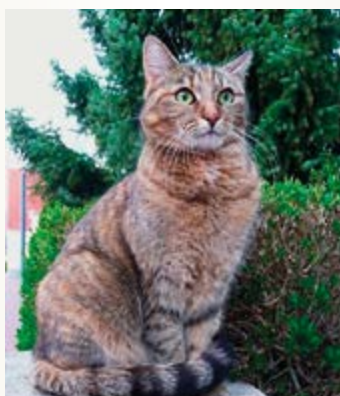
Katze 60x90 cm 9 Euro