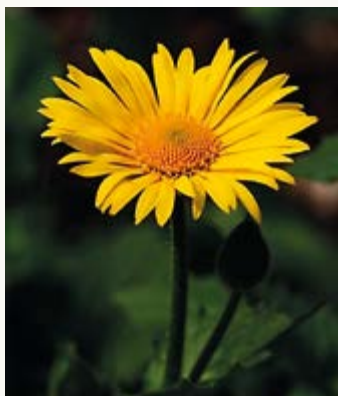
Blume 70x100 cm 10 Euro