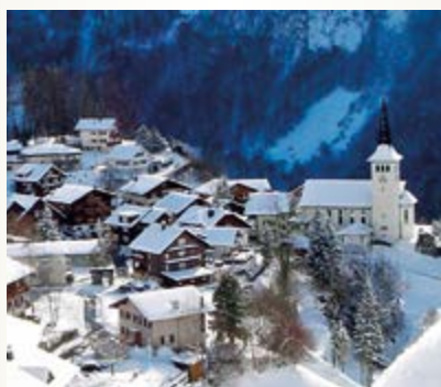
Dorf im Winter 50x50 cm 8,50 Euro