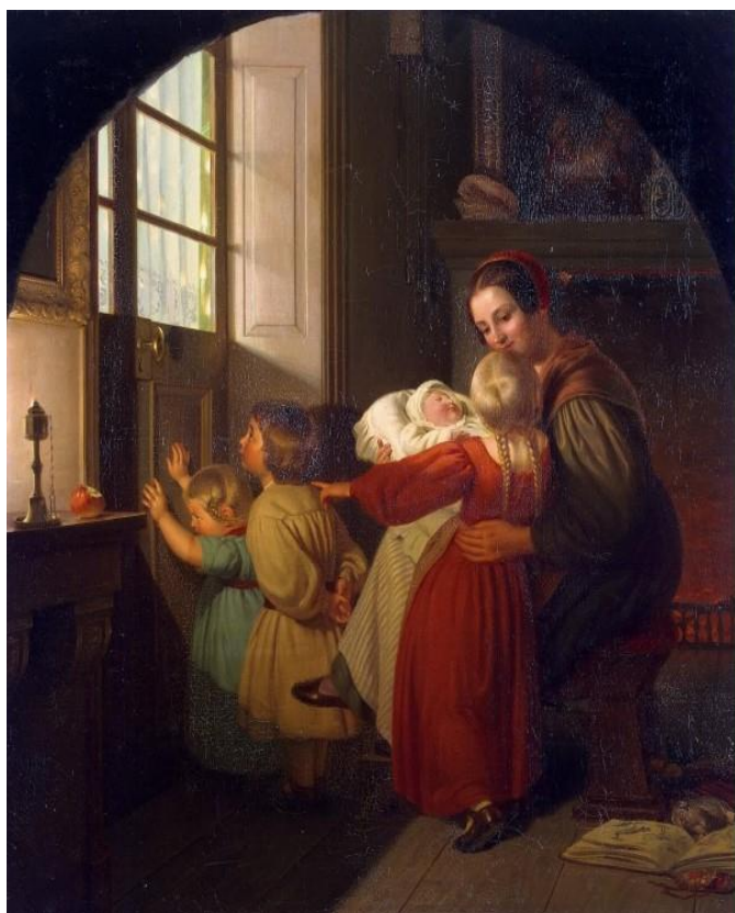
Τα παιδιά προσμένουν τη γιορτή Theodor Hildebrandt