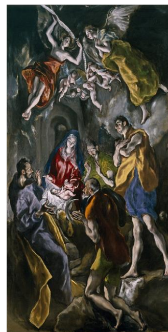
Η προσκύνηση των ποιμένων Δομήνικος Θεοτοκόπουλος – Ελ Γκρέκο 1614