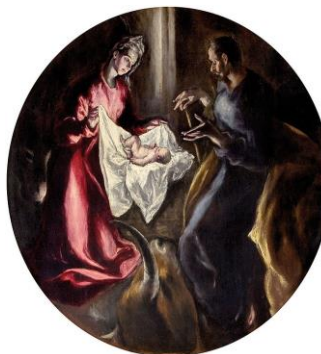
Η Γέννηση Δομήνικος Θεοτοκόπουλος – Ελ Γκρέκο 1603-05