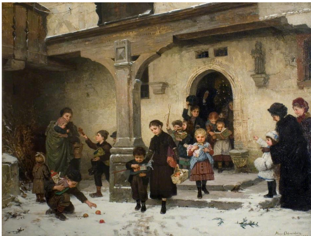
Χριστουγεννιάτικα δώρα Hugo Oehmichen – 1882

3. Τα παιδιά της εικόνας μόλις έχουν πάρει τα χριστουγεννιάτικα δώρα τους. Μπορείς να ξεχωρίσεις τι δώρο πήρε το κάθε παιδί; Ποια άτομα εκτός από την οικογένειά σου θα ήθελες να πάρουν φέτος κάποιο δώρο; Τι δώρο θα ήταν αυτό;