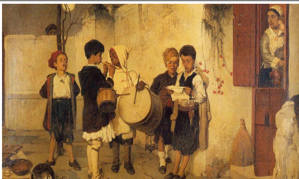
Τα κάλαντα Νικηφόρος Λύτρας 1872

4. Τα παιδιά που λένε τα κάλαντα είναι διαφόρων εθνικοτήτων. Από πού το καταλαβαίνουμε αυτό; Γιατί ο ζωγράφος διάλεξε να το κάνει αυτό; Τι να σκέφτεται το παιδί που κρυφοκοιτάζει πίσω από τον τοίχο;