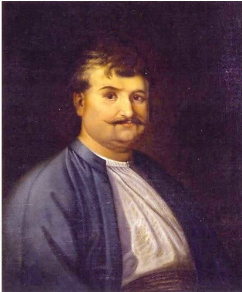
Ρήγας Βελεστινλής – Φεραίος

ιδέες του για μία ελεύθερη και δημοκρατική πολιτεία. Οι Έλληνες διανοούμενοι τον αποκαλούσαν Φεραίο γιατί στην αρχαιότητα η πόλη του ονομαζόταν Φερές. Δυστυχώς οι επαναστατικές προκηρύξεις που βρέθηκαν στις αποσκευές του Ρήγα Βελεστινλή ενώ ταξίδευε για την Τεργέστη τον έστειλαν στη φυλακή. Ύστερα από συνεχή βασανιστήρια στις 24 Ιουνίου του 1798 θανατώθηκε και πετάχτηκε το άψυχο κορμί του στο Δούναβη. Ο Ρήγας Βελεστινλής χαρακτηρίζεται εθνομάρτυρας της Ελληνικής Επανάστασης του 1821. Ήταν ο άνθρωπος που τόνωσε το ηθικό των Ελλήνων και αφύπνισε την συνείδησή τους διδάσκοντας τους πως με τις δικές τους δυνάμεις θα αποκτούσαν την ελευθερία που τόσο ποθούσαν.