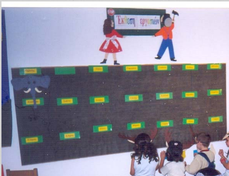
Ταμπλό με καρτέλες με γραφή μικρού ονόματος