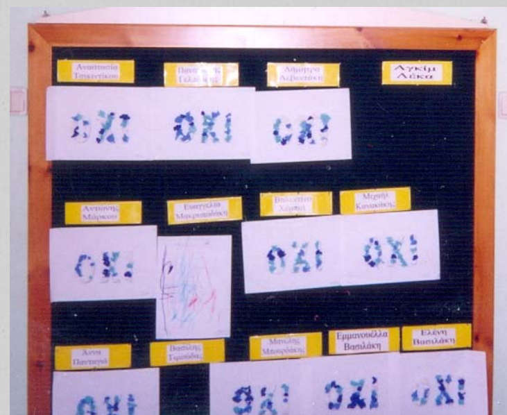
Ταμπλό με καρτέλες με γραφή μικρού ονόματος και επώνυμου