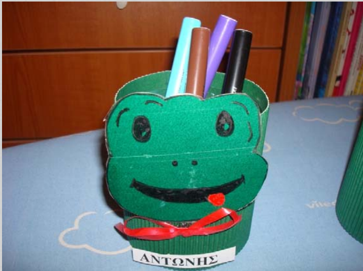
Ετικέτα σε ατομική μολυβοθήκη του μαθητή