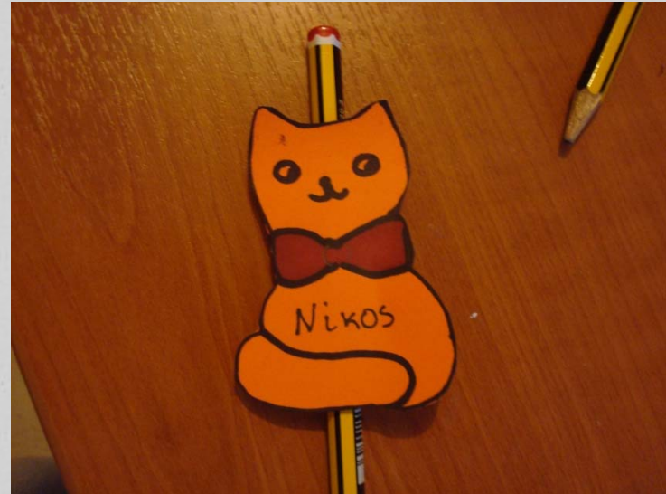
Ετικέτα σε μολύβι