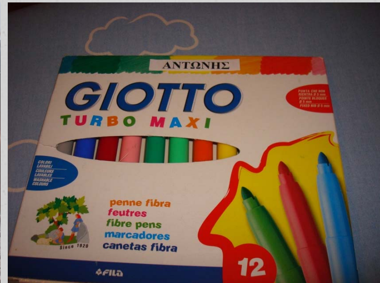
Ετικέτα σε κουτί με μαρκαδόρους