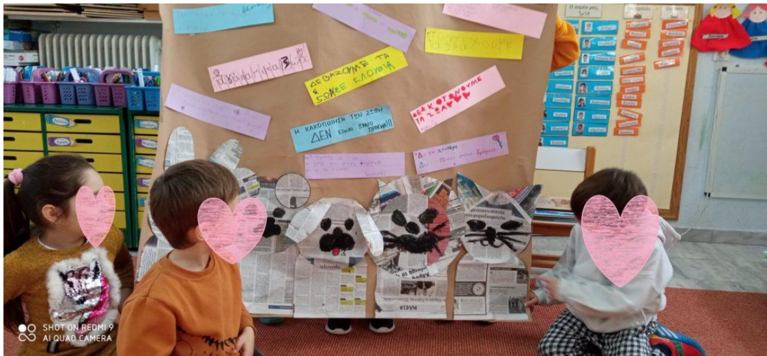
η τελική αφίσα μας