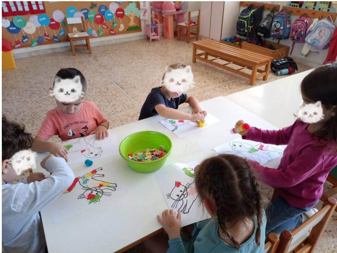
οι φίλοι μας τα ζώα συντροφιάς