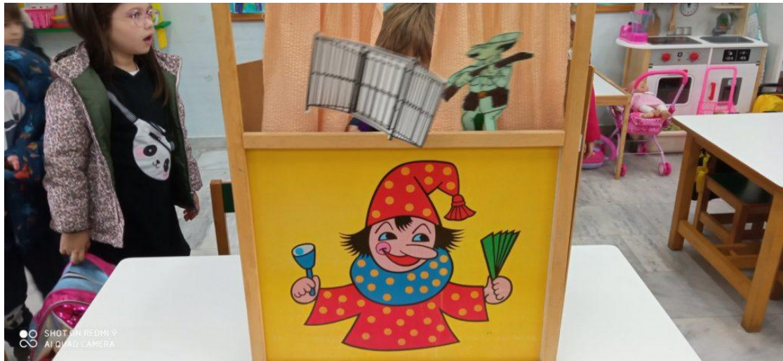
κουκλοθέατρο "η περιπέτεια της οικογένειας των ιπποπόταμων"