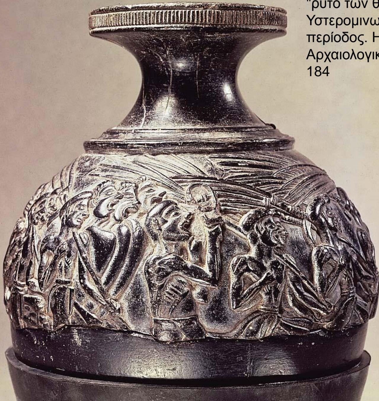
Αγία Τριάδα. Το λίθινο "ρυτό των θεριστών". Υστερομινωική ΙΑ περίοδος. Ηράκλειο, Αρχαιολογικό Μουσείο 184