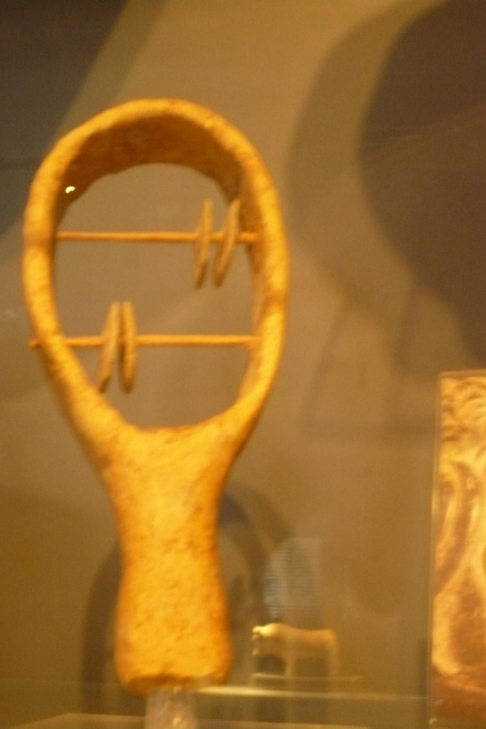
Αρχαιολογικό Μουσείο Αρχανών: πήλινο σείστρο (αντίγραφο)