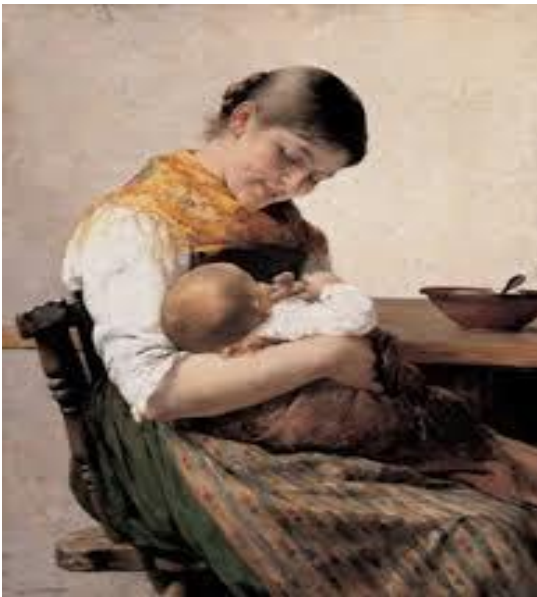
Μητρική στοργή, 1889, Γιώργος Ιακωβίδης