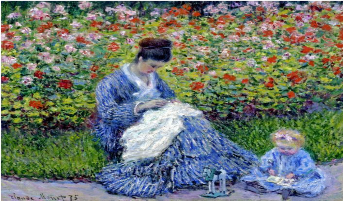
Μητέρα και παιδί, 1875, Καμίλ Μονέ