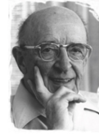
ΒΑΣΙΚΟΣ ΕΚΠΡΟΣΩΠΟΣ και θεμελιωτής: Carl Rogers (1902-1987)

"Ο μόνος άνθρωπος που είναι πραγματικά μορφωμένος είναι εκείνος που έχει μάθει πώς να μαθαίνει και πώς να αλλάζει"