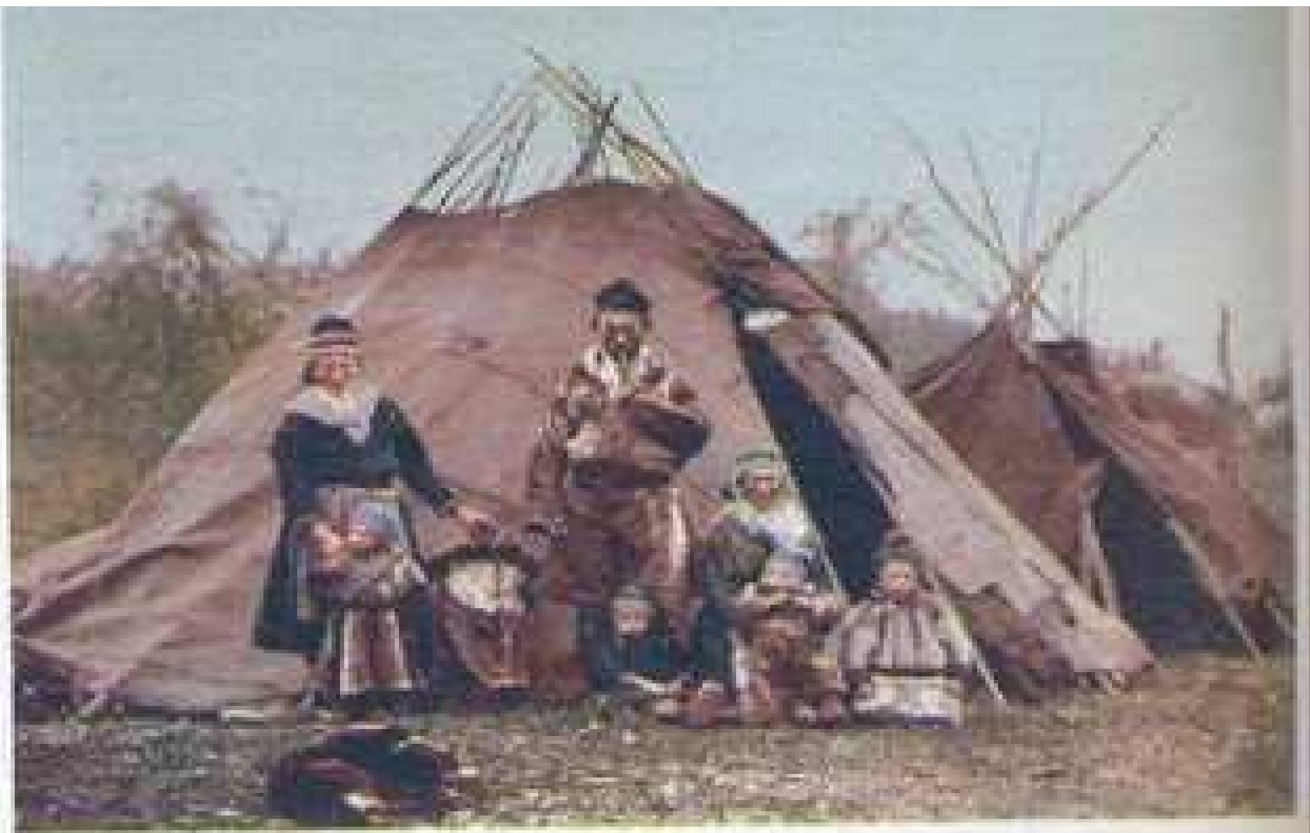
Οικογένεια Λαπώνων σε φωτογραφία του 1900 περίπου.