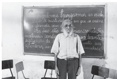
Πάουλο Φρέιρε (1921-1997) Βραζιλιάνος παιδαγωγός.

Έκανε μεγάλα προγράμματα καταπολέμησης του αναλφαριθμητισμού στη Βραζιλία και υποστήριξε πως η εκπαίδευση μπορεί να αλλάξει καθοριστικά τη ζωή των ανθρώπων.