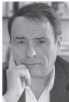
Πιερ Μπουρντιέ (1930-2002)

Ο Γάλλος κοινωνιολόγος Πιερ Μπουρντιέ (P. Bourdieu) μελέτησε συστηματικά και σε βάθος το πώς οι κοινωνικές ανισότητες επηρεάζουν κάθε πτυχή της ζωής των ανθρώπων και πώς αναπαράγονται. Ο Μπουρντιέ υποστήριξε ότι υπάρχουν τέσσερα είδη κεφαλαίου. Οι ευκαιρίες που έχει το άτομο στη ζωή του για κοινωνική άνοδο εξαρτώνται από αυτά τα τέσσερα είδη κεφαλαίου: