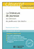
La littérature de jeunesse au CRPE