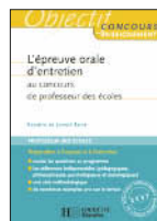
L'épreuve orale d'entretien au CRPE