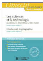
Les sciences et la technologie composante majeure au CRPE