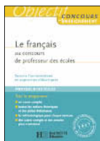
Le français au CRPE