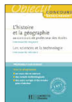
L'histoire et la géographie composante majeure au CRPE