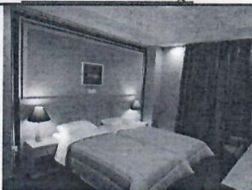
Τιμή με πρωινό 113 € (€)