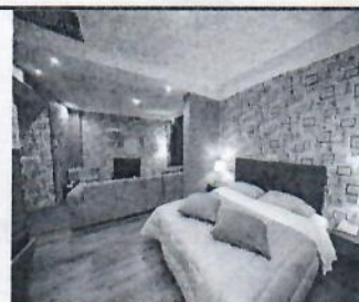
Τιμή με ημιδιατροφή 119€(€)