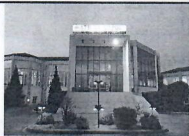
B' Cat ★★★