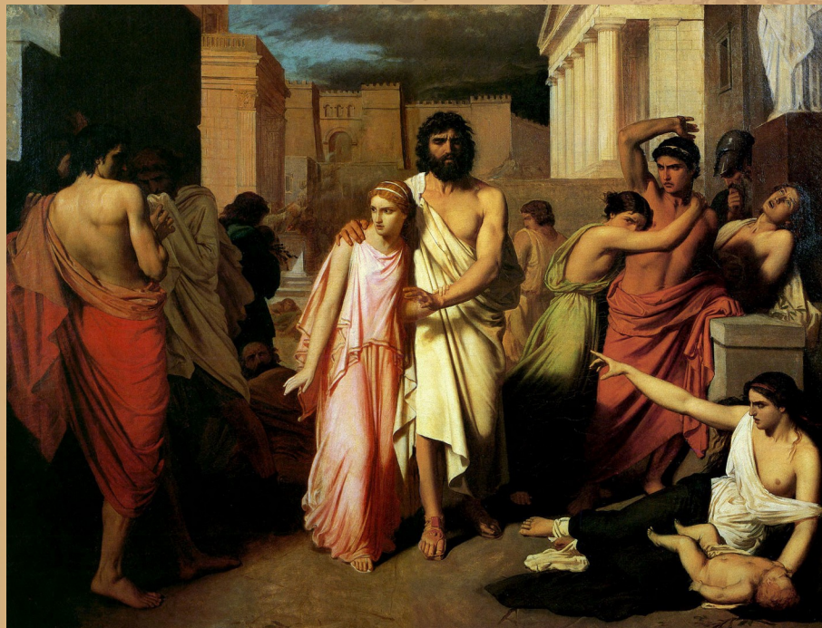
The Plague of Thebes