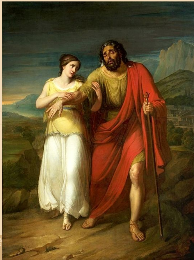
Oedipus and Antigone by Aleksander Kokular (1825–1828), National Museum, Warsaw

τραγωδία του Σοφοκλή που παρουσιάστηκε πιθανότατα στα Μεγάλα Διονύσια του 441 π.Χ. Το θέμα της προέρχεται από τον Θηβαϊκό κύκλο , απ' όπου ο Σοφοκλής άντλησε υλικό και για δύο άλλες τραγωδίες του, τον Οιδίποδα Τύραννο και τον Οιδίποδα επί Κολωνώ . Τα μυθοπλαστικά γεγονότα της Αντιγόνης είναι μεταγενέστερα χρονολογικά από εκείνα των τραγωδιών για τον Οιδίποδα , αλλά η Αντιγόνη παρουσιάστηκε πριν από αυτές.