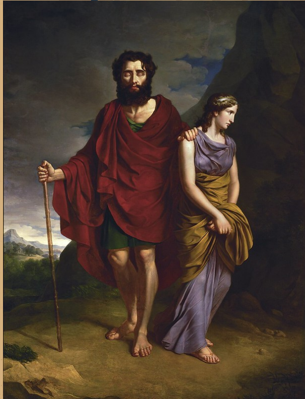
Antoni Brodowski - Oedipus and Antigone (1828)

Τα στοιχεία του χαρακτήρα της, ξεφεύγουν από το πρότυπο της εποχής ως γυναίκα καθώς σκιαγραφείται μέσα από την αντίθεση με την αδελφή της. Το ανυποχώρητο πείσμα και η αταλάντευτη αποφασιστικότητά της, την οδηγούν στο να εκτελέσει αυτό που θεωρεί ηθικό. Αν και λογική, δεν παύει να είναι διορατική και εκδηλωτική ως προς την αγάπη της για την αδελφή της, ενώ ταυτόχρονα βιώνει έντονη συναισθηματική φόρτιση, θλιμμένη για τις συμφορές που χτυπούν την οικογένειά της αλλά και για