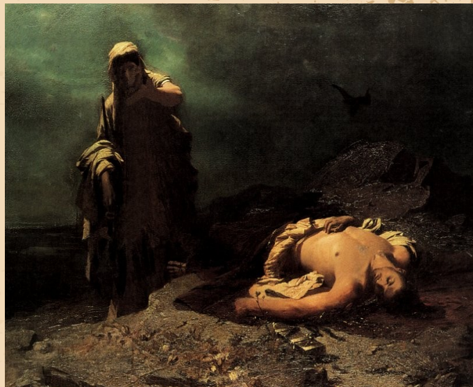
Antigone in front of the dead Polynices by Nikiforos Lytras 1865

Όταν ο Οιδίποδας ανακάλυψε την αλήθεια για την καταγωγή του αυτοεξορίστηκε και τα δύο αδέρφια συμφώνησαν να διακυβερνούν εναλλάξ ανά ένα χρόνο. Μετά το πρώτο έτος ο Ετεοκλής αρνήθηκε να δώσει το θρόνο στον Πολυνείκη και αυτός έφυγε από τη Θήβα, πήγε στο Άργος, όπου παντρεύτηκε την κόρη του βασιλιά Άδραστου και οργάνωσε εκστρατεία εναντίον της Θήβας. Η εκστρατεία απέτυχε και οι δύο αδερφοί σκοτώθηκαν σε μονομαχία. Το θρόνο πήρε τότε ο Κρέων, αδερφός της Ιοκάστης, που διέταξε το πτώμα του Πολυνείκη να μείνει άταφο, επειδή πρόδωσε την