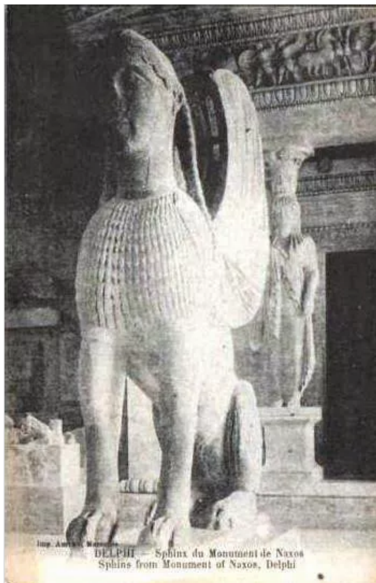
DELPHI — Sphinx du Monument de Naxos Sphinx from Monument of Naxos, Delphi