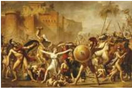
“ Σαβίνες ” David (1785)

Anton Raphael Mengs, Jacques-Louis David, Ingres