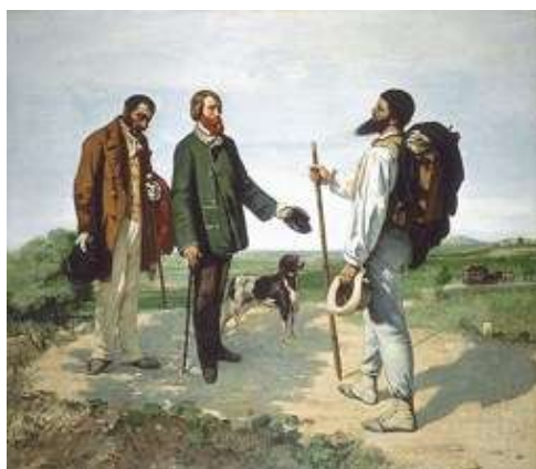
“ Καλημερα κυριε Courbet” Courbet(1849)

Από τους κύριους εκφραστές είναι: Gustave Courbet, Édouard Manet, Edgar Degas, Daumier, Millet