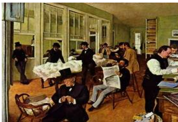
“New Orlean Cotton Exchange” Degas (1873)