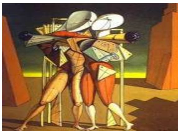
“Εκτορας και Ανδρομαχη” De Chirico (1917)