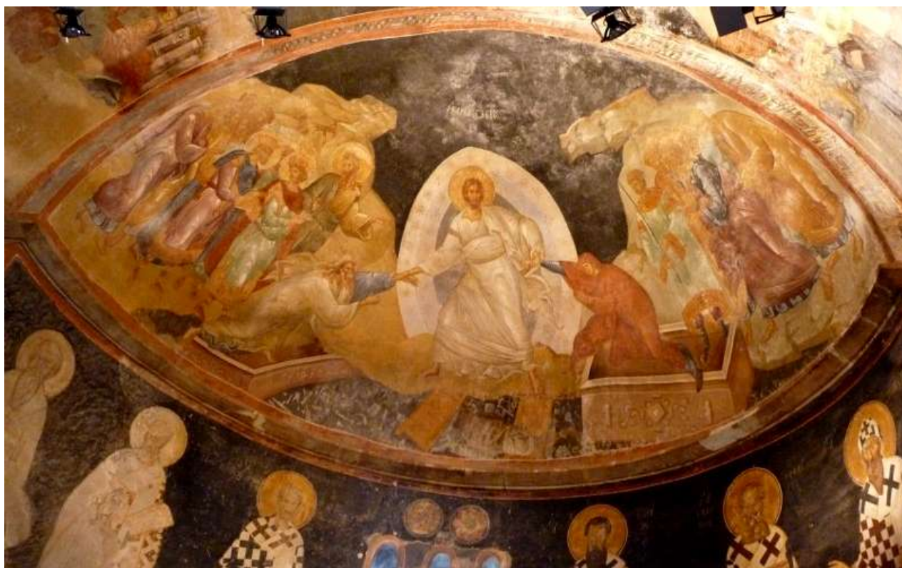
Μονή της Χώρας (Κωνσταντινούπολη)

Από τους πρώτους βυζαντινούς χρόνους μέχρι την εικονομαχία σώθηκε μικρός αριθμός τοιχογραφιών που δείχνουν ότι την περίοδο αυτή οι ιδέες και αρχές του ελληνορωμαϊκού κόσμου παραμένουν ζωντανές. Οι μορφές με κλασική χάρη και αβρότητα, ζωηρή κίνηση και πλαστικότητα, αποδίδονται με τις αρχές της ελληνοβυζαντινής ζωγραφικής και αποκτούν νέο περιεχόμενο για να αποτυπώσουν τα ιερά πρόσωπα της νέας θρησκείας.