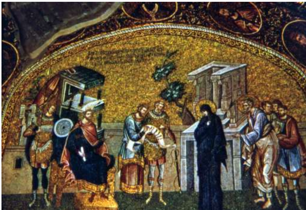
Μονή της Χώρας (Κωνσταντινούπολη)

Με την άνοδο της βυζαντινής αυτοκρατορίας από τον 5ο αιώνα τούτη η μορφή τέχνης απέκτησε νέα χαρακτηριστικά. Σε αυτά τα χαρακτηριστικά περιλαμβάνονται οι ασιατικές τεχνοτροπικές και ειδολογικές επιδράσεις και η χρήση ειδικών υάλινων ψηφιδών που κατασκευάζονταν στη βόρεια Ιταλία καταρχήν και τις γνωρίζουμε με τον γενικό όρο σμάλτα. Τα σμάλτα κατασκευάζονταν από παχιά στρώματα έγχρωμης υάλου, είχαν ακανόνιστη επιφάνεια και περιείχαν μικροσκοπικές φυσαλίδες αέρα. Ενίοτε στην οπίσθια όψη τους ήταν καλυμμένα με αργυρά ή χρυσά λεπτά φύλλα, προκειμένου να παράγουν το ανάλογο αισθητικό αποτέλεσμα της υποφώσκουσας φωτεινότητας, μιας αφαιρετικής διάστασης της ιερότητας, που δεν απαντάται σε καμία άλλη περίοδο της τέχνης του ψηφιδωτού.