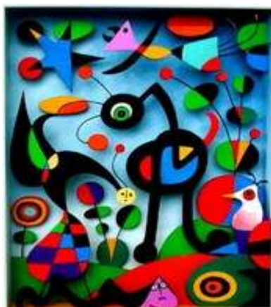
“The Garden” Miro