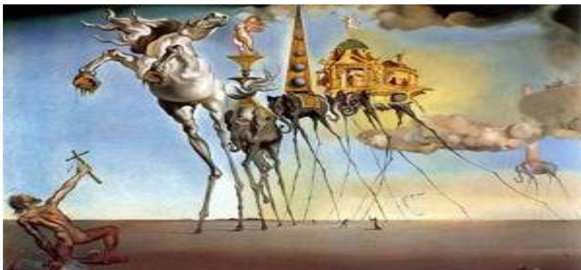
“Οι προκλήσεις του Αγίου Αντωνίου” Dali (1946)

Από τους κύριους εκφραστές είναι: Giorgio de Chirico, Salvador Dalí, Joan Miró