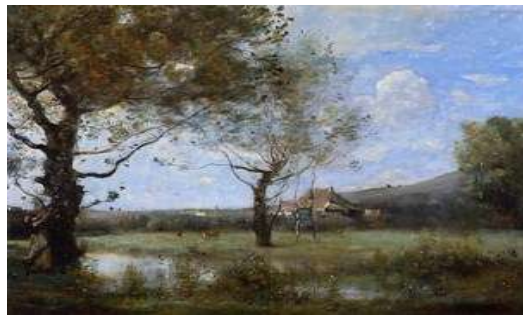
“Λιβαδι με δεντρα” Corot(1870)