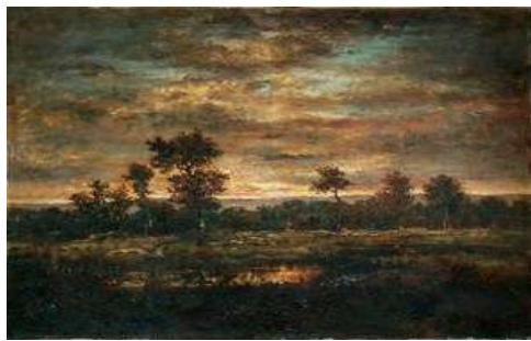
“Mare et Lisiere de Bois” Rousseau(1865)

Από τους κύριους εκφραστές είναι: Théodore Rousseau, Camille Corot