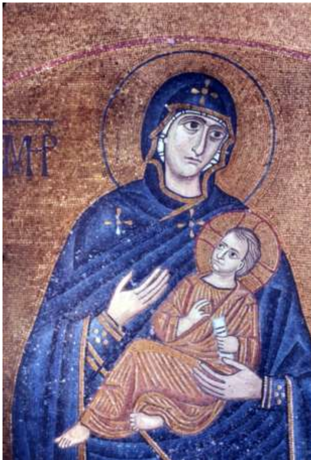
Μονή Οσίου Λουκά (Βοιωτία)