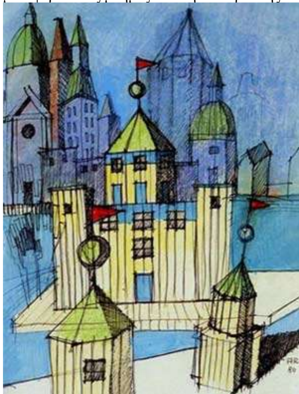
teatro del mondo 1980

Ο Ιταλός αρχιτέκτονας Άλντο Ρότσι (1931-1997) πειραματίστηκε πάνω στα χρώματα και τα υλικά, στο πλαίσιο μιας αρχιτεκτονικής, όμως, που συνεχίζει να βασίζεται στην επανάληψη λίγων αλλά βασικών αρχιτεκτονικών στοιχείων, τα οποία μεταφέρουν τις μνήμες από την ιστορία της πόλης.