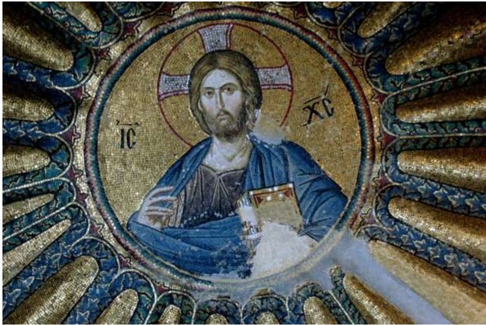
Μονή της Χώρας (Κωνσταντινούπολη)