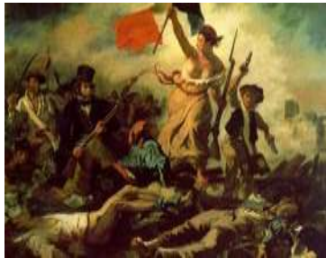
'' Η ελευθερια οδηγει το λαο'' Delacroix (1830)

Από τους κύριους εκφραστές είναι: Goya, Delacroix, Turner, David Friedric, Théodore Gericault