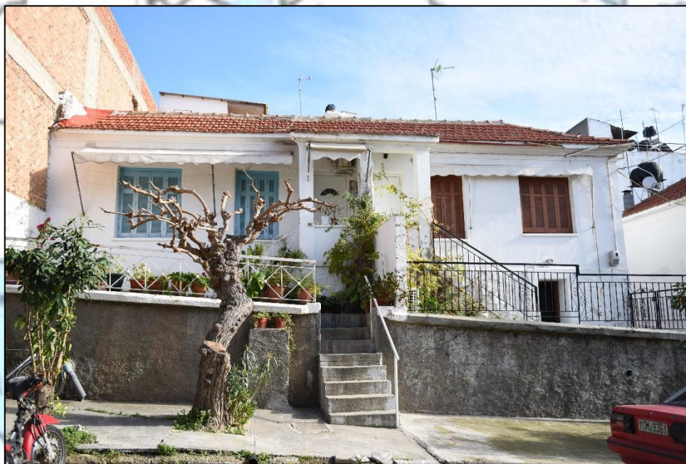
Εικόνα 6. Προσφυγικό σπίτι (καλοδιατηρημένο)

Η Βαρβάρα είναι ένα αμιγώς Ποντιακό χωριό, 6 χμ από τα Λουτρά της Αιδηψού. Οι πρόσφυγες που εγκαταστάθηκαν εκεί κατάγονταν από την Τσολόχαινα, το Αμπρίκ, την Κερα-