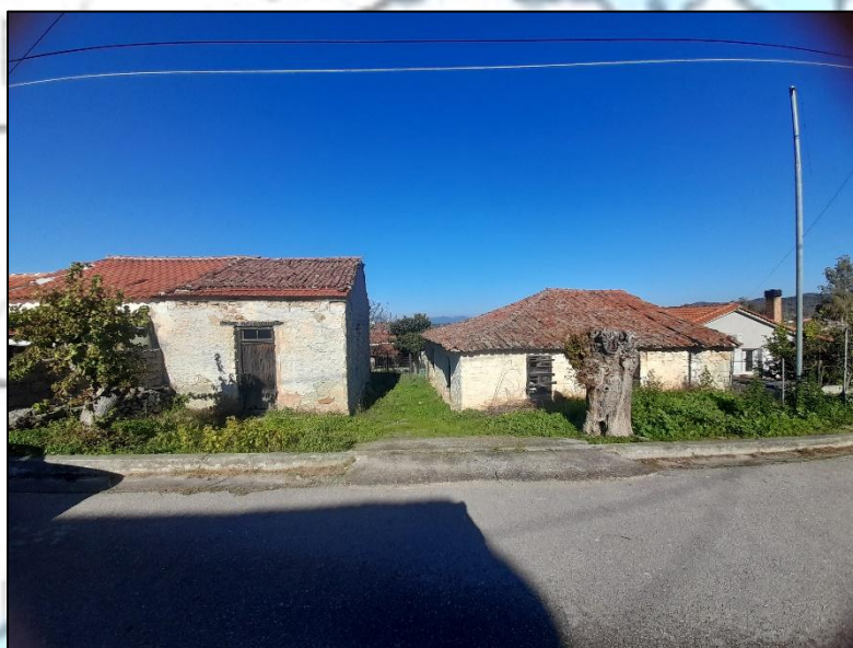
Εικόνα 9. Προσφυγικό σπίτι (αριστερά) Αποθήκες και στάβλος (δεξιά) Κλήρος Νικολαΐδη, Βαρβάρα.

Συζητώντας με απογόνους τρίτης γενιάς, μαθαίνουμε πως η εγκατάσταση στην ευρύτερη περιοχή της Αιδηψού δεν ήταν εύκολη. Οι πρόσφυγες, κατεστραμμένοι και ψυχικά τραυματισμένοι, έφεραν μαζί τους αντικείμενα, τα οποία έχουν μείνει ως κληρονομιά, όπως εικόνες και φωτογραφίες, διαφορετικά έθιμα, ήθη και αντιλήψεις. Γι' αυτό μία ακόμα πρόκληση που έπρεπε να αντιμετωπίσουν ήταν η ένταξη τους στην κοινωνία. Οι γηγενείς δυσκολεύονταν να τους αποδεχτούν, θεωρώντας τους ξένους και αποκαλώντας τους «Τουρκόσπορους». Ωστόσο, η όρεξη αυτών των ανθρώπων για εργασία και η ανάπτυξη