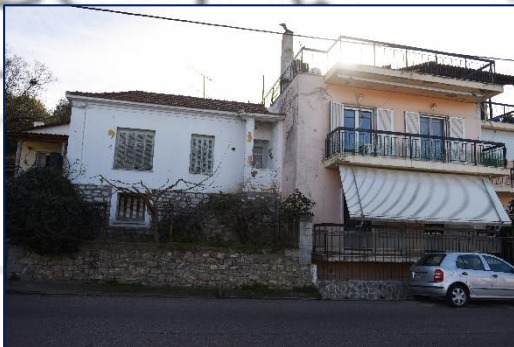
Εικόνα 1. Σύγκριση προσφυγικού και σύγχρονου σπιτιού

Στο χωριό της Αιδηψού, δημιουργήθηκε ένας προσφυγικός οικισμός όπου εγκαταστάθηκαν άτομα από την περιοχή του Τσεσμέ (Κρήνη ή Κιόστε) της Μ. Ασίας και από την ευρύτερη περιοχή: το Μελί, την Αγία Παρασκευή, και τα Αλάτσατα. Η μετεγκατάσταση δεν ήταν εύκολη, γρήγορα όμως οι άνθρωποι κατάφεραν να ορθοποδήσουν ασχολούμενοι, κυρίως, με τη αλιεία εφαρμόζοντας μάλιστα καινοτόμες πρακτικές. Μερικά γνωστά επίθετα είναι τα: Αλατσατιανός, Υψηλάντης, Αικατερίνης, Τσερβελής. Εγκαταστάθηκαν στις παρυφές του χωριού, σε γειτονιά που και σήμερα ονομάζεται Συνοικισμός.