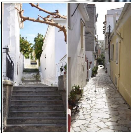
Εικόνα 5. Σκαλιά και σοκάκι Συνοικισμού Λ.Αιδηψού