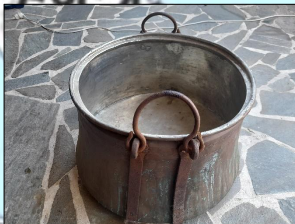
Εικόνα 8. Καζάνι που χρησιμοποιήθηκε ως βαλίτσα