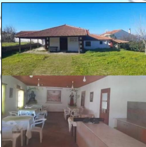
Εικόνα 7. Εξωτερικό και εσωτερικό Σχολείου Βαρβάρας

σούντα, το Μπελέν, την Κουρκούτα της Χαλδίας και την Τραπεζούντα. Μερικά επίθετα είναι τα: Μαρ(ι)νάς, Αμανατίδης, Δεσκούλιδης, Φερίδης, Μαυρίδης, Μηλόπουλος. Για άλλη μία φορά το κράτος έδωσε σε κάθε οικογένεια ένα σπίτι και επιπλέον 60 στρέμματα γης σε διάφορα σημεία (πλαγιές, κάμποι, βοσκοτόπια). Οι άνθρωποι ασχολούνταν κυρίως με την γεωργία και την κτηνοτροφία και χάρη στην εφευρετικότητα και την εργατικότητα τους κατάφεραν να αποστραγγίσουν τα βαρκά (λασπώδη) χωράφια του κάμπου με σούδες (κανάλια) δημιουργώντας ιδιαίτερα εύφορη γη. Επίσης, εισήγαν στην περιοχή την εκτροφή μεταξοσκώληκα και εμπορεύονταν μεταξωτά υφαντά ή το μετάξι από τα κουκούλια.