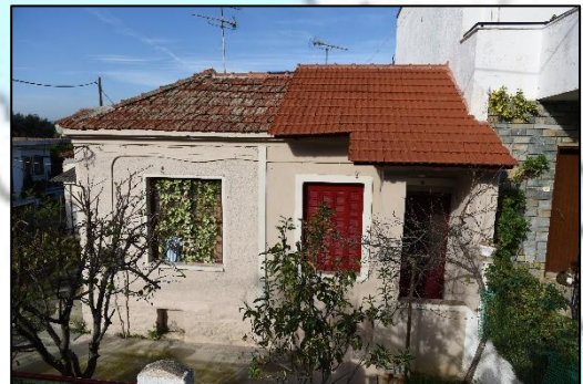
Εικόνα 2. Ανακαινισμένο προσφυγικό σπίτι