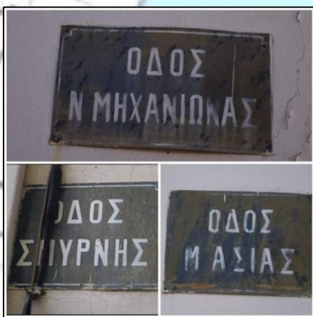
Εικόνα 4. Οδοί Συνοικισμού Λ. Αιδηψού

σκευή, το Μελί και λίγοι από τα Βουρλά, καθώς και την Ανατολική Θράκη. Ο Συνοικισμός τους βρίσκεται στις οδούς Μ. Ασίας, Σμύρνης και Νέας Μηχανιώνας. Οι Μηχανιώτες έφτασαν την 1 Νοεμβρίου 1924. Σε ανάμνηση της άφιξής τους γιορτάζει και η εκκλησία της Παναγίας Φανερωμένης ή Μηχανιωτίσσης που ανεγέρθηκε στην Αιδηψό το 2012. Περίπου τα 2/3 των αφιχθέντων εγκατέλειψαν την περιοχή μαζί με τη θαυματουργή εικόνα, για να εγκατασταθούν στη σημερινή Νέα Μηχανιώνα Θεσσαλονίκης, μιας και η περιοχή θεωρήθηκε ιδανικότερη για να ασκήσουν την αλιεία. Η πλειοψηφία όσων εγκαταστάθηκαν στα Λουτρά της Αιδηψού ανήκε σε εύπορες οικογένειες. Η τεχνογνωσία τους, οι νέες καλλιέργειές τους και η εμπειρία τους στη θάλασσα έδωσαν ώθηση στη Λουτρόπολη, οργανώνοντας την αλιεία, αναπτύσσοντας την γεωργία και το εμπόριο. Γνωστά επίθετα παραμένουν τα: Εμμανουήλ, Κατανάκης, Ματάκις, Παντελιδάκης. Η περιοχή της εγκατάστασής τους, σήμερα πια στο κέντρο της πόλης, ακόμα ονομάζεται Συνοικισμός.